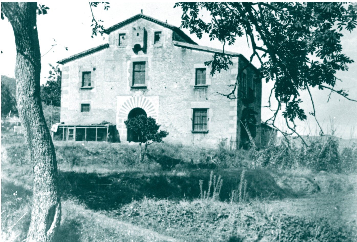
Can Coix el 1932.