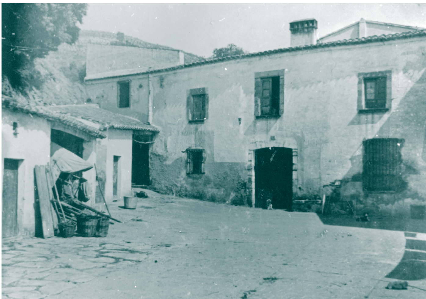
Can Martí de la Pujada el 1932.