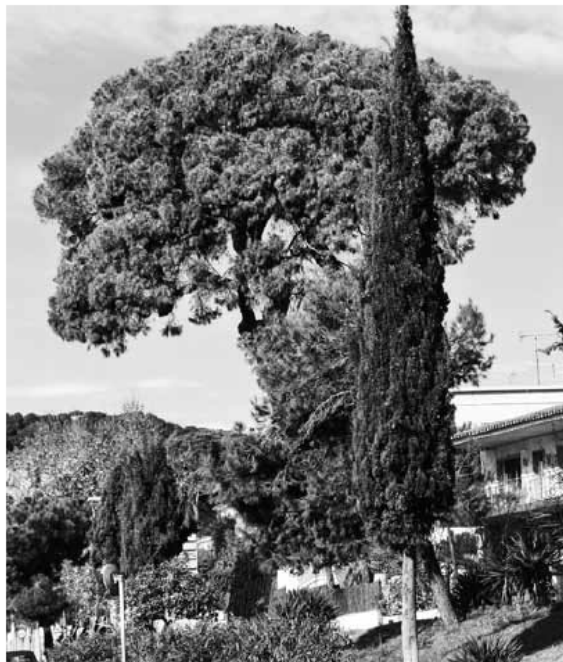
El Pi Gros.

S í, el Pi Gros del Sant Crist ( Pinus pinea ), el pi més gran dels diferents exemplars que hi ha a l'entrada sud d'Argentona, s'ha mort, i segurament, també hi té molt a veure com s'han fet les coses des que es van presentar els primers símptomes, al passat novembre.