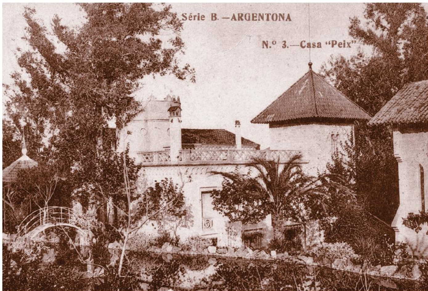
Can Peix. Postal Madriguera (~1908). Arxiu Enric Subiñà