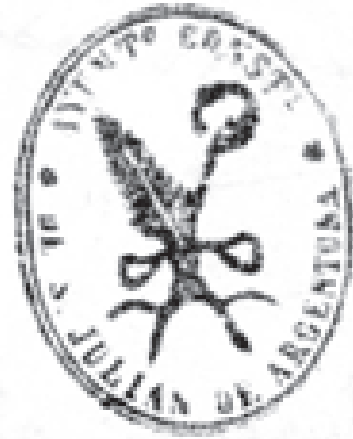
↑ Escut de 1901

Per altra banda, hi ha qui argumenta que en un estat aconfessional com el nostre, no tenen cabuda imatges d'iconografia religiosa i menys restaurar-la quan ja