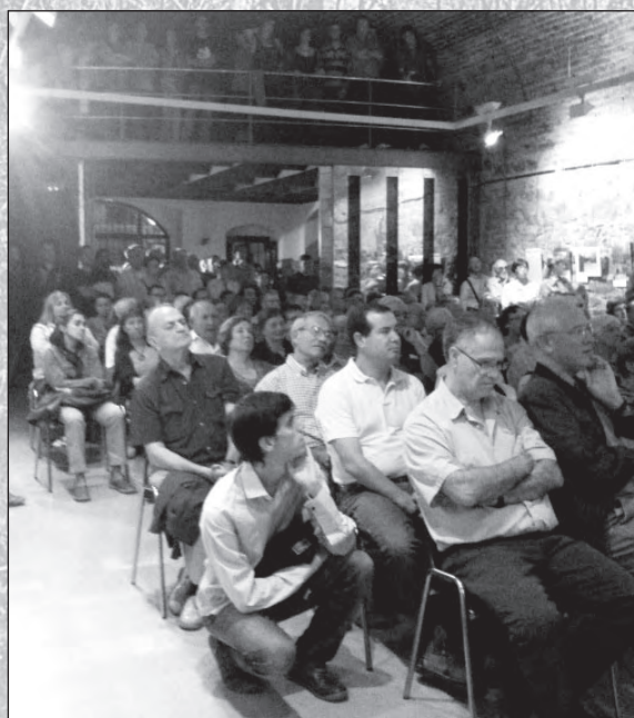
Inauguració exposició.