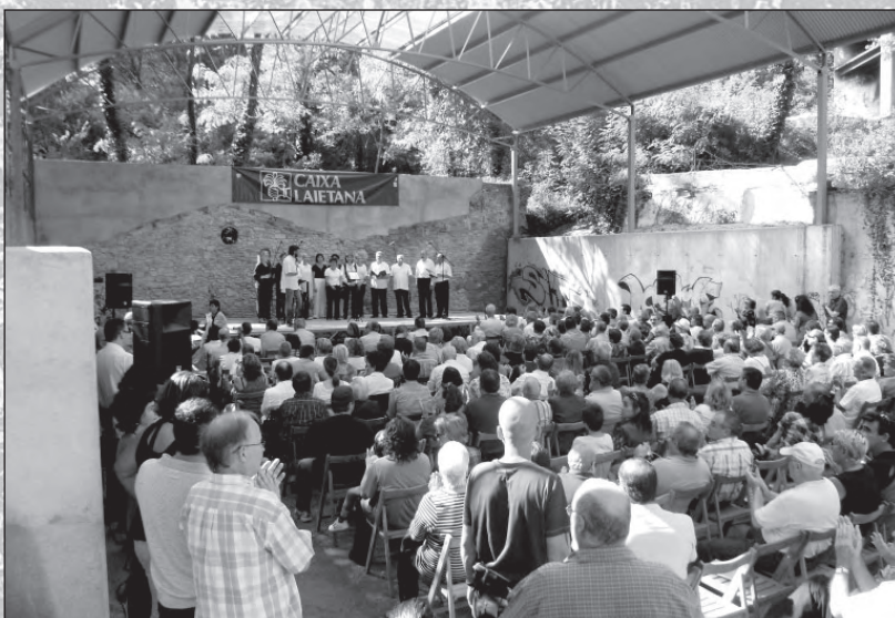
Cantada de Corals.