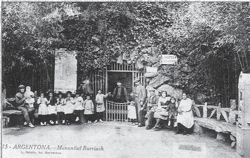
15 - ARGENTONA.— Manantial Burriach