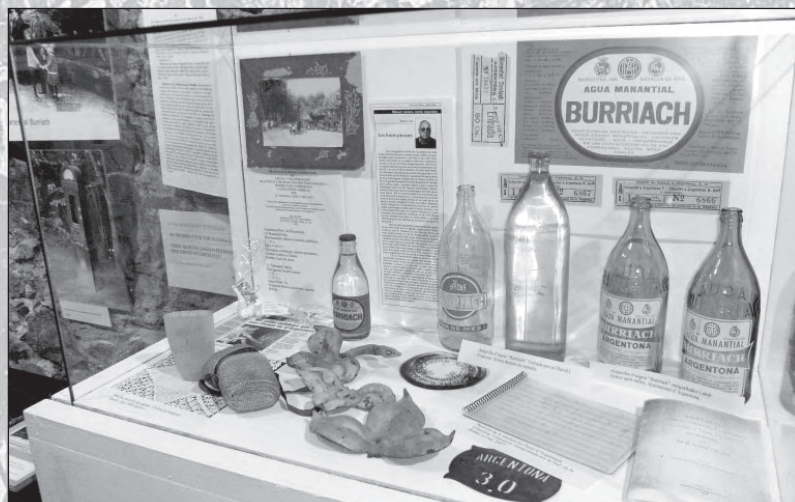
Detall d'una vitrina.