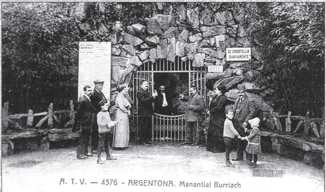
A. T. V. — 4376 - ARGENTONA. Manantial Burriach