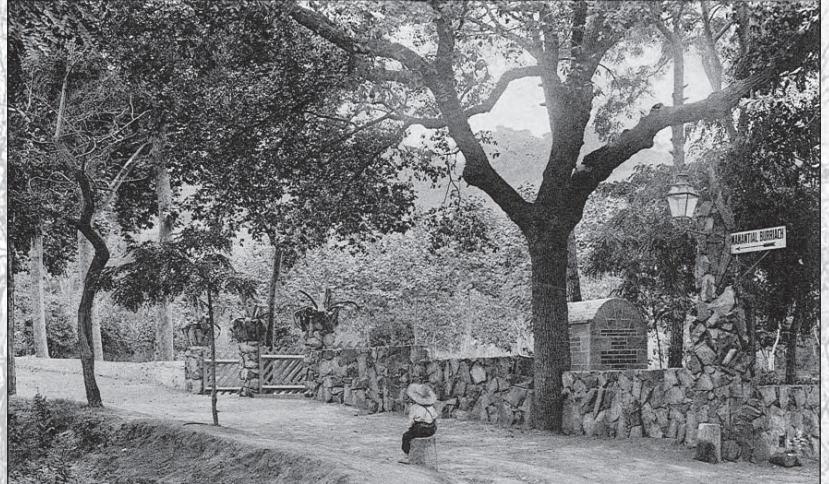
ARGENTONA — Manantial Burriach — Entrada Agua natural Acidula — Bicarbonatada — Cállica — Excelente para la mesa