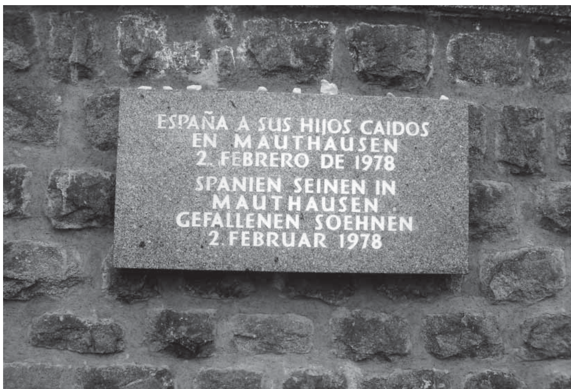
| Placa de Mauthausen

La vicepresidenta Teresa Fernández de la Vega, en el seu discurs va dir que el contrari de la veritat era la mentida i que això és molt greu, però encara és més greu