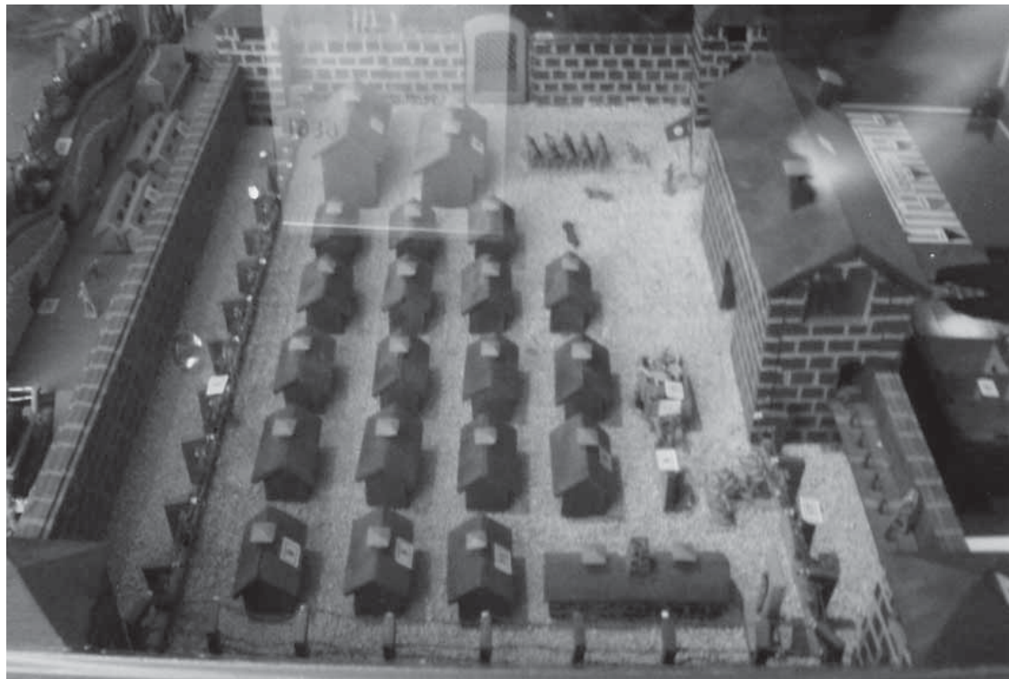
Maqueta dels barracots de Mauthausen