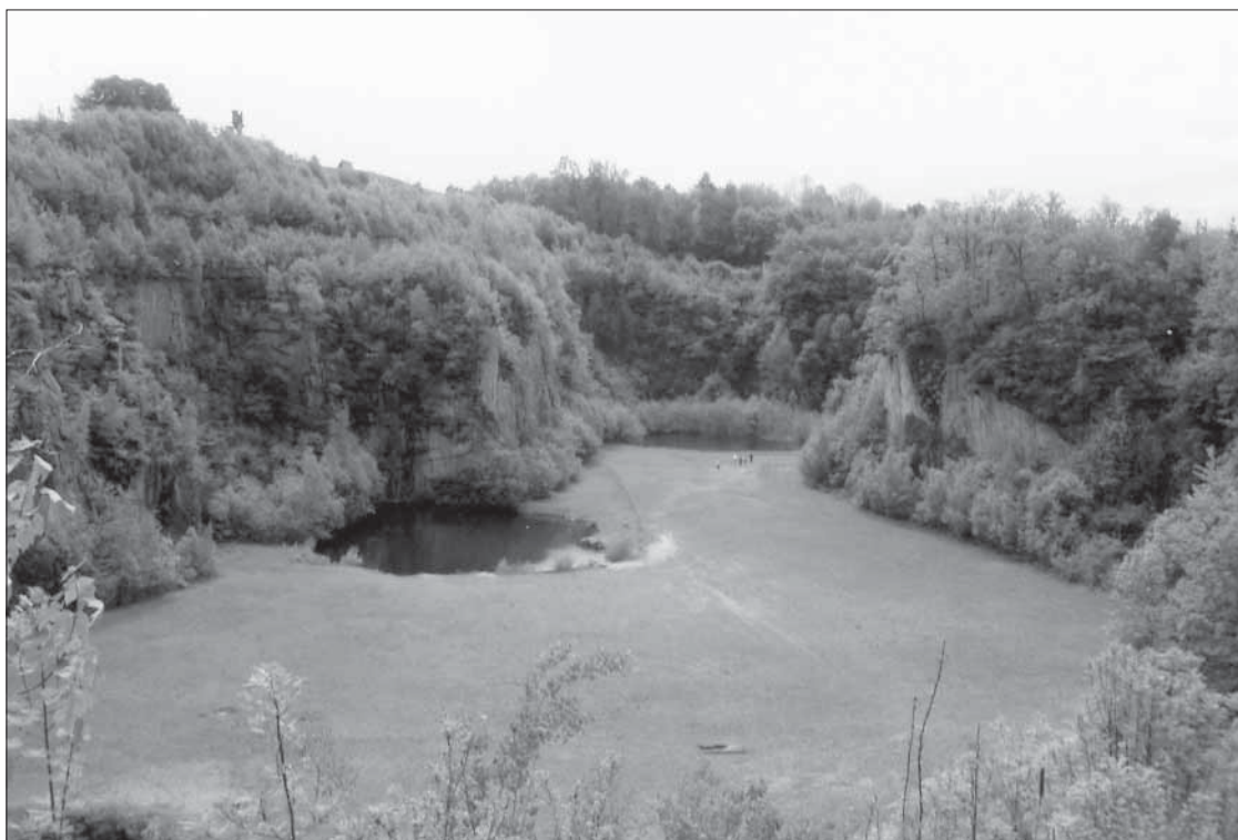
Paratge on hi havia la pedrera.

Primer varem visitar el castell Hartheim. A partir de 1939 va ser un centre d'eutanàsia per a discapacitats mentals i físics, sense el consentiment dels familiars. Quan els familiars varen començar a rebre certificats de mort van dubtar del procediment de tantes morts, van voler investigar i descobrir la veritat. Aleshores, es va fer de manera clandestina. El mateix Hitler va fer una llei per emparar els professionals sanitaris d'aquesta activitat clínica. Tot això es feia en base a la teoria de la millora de la "RAÇA". Una