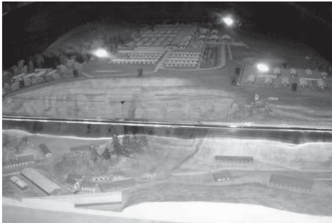
| Gusen (maqueta)

La Història és així, pot servir per fer una anàlisi dels fets històrics però alhora també ha de ser útil per ajudar a entendre millor les claus dels nostres dies.