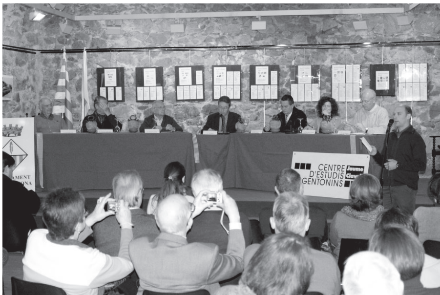
Participants a l'acte dels 30 anys d'ajuntaments democràtics.