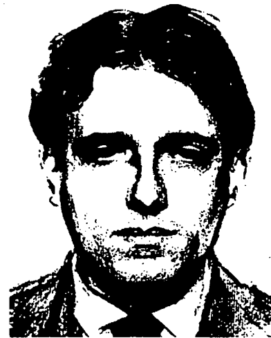
Eugeni d'Ors segons un dibuix de Ramon Casas

No cal, doncs, que ens hi posem cap pedra al fetge ni entrem en discussions bizantines, si algú ens regateja l'argentonisme de la Ben Plantada. Com acabem de veure, era una mica de tots i potser fou en això on va raure l'èxit de l'obra.