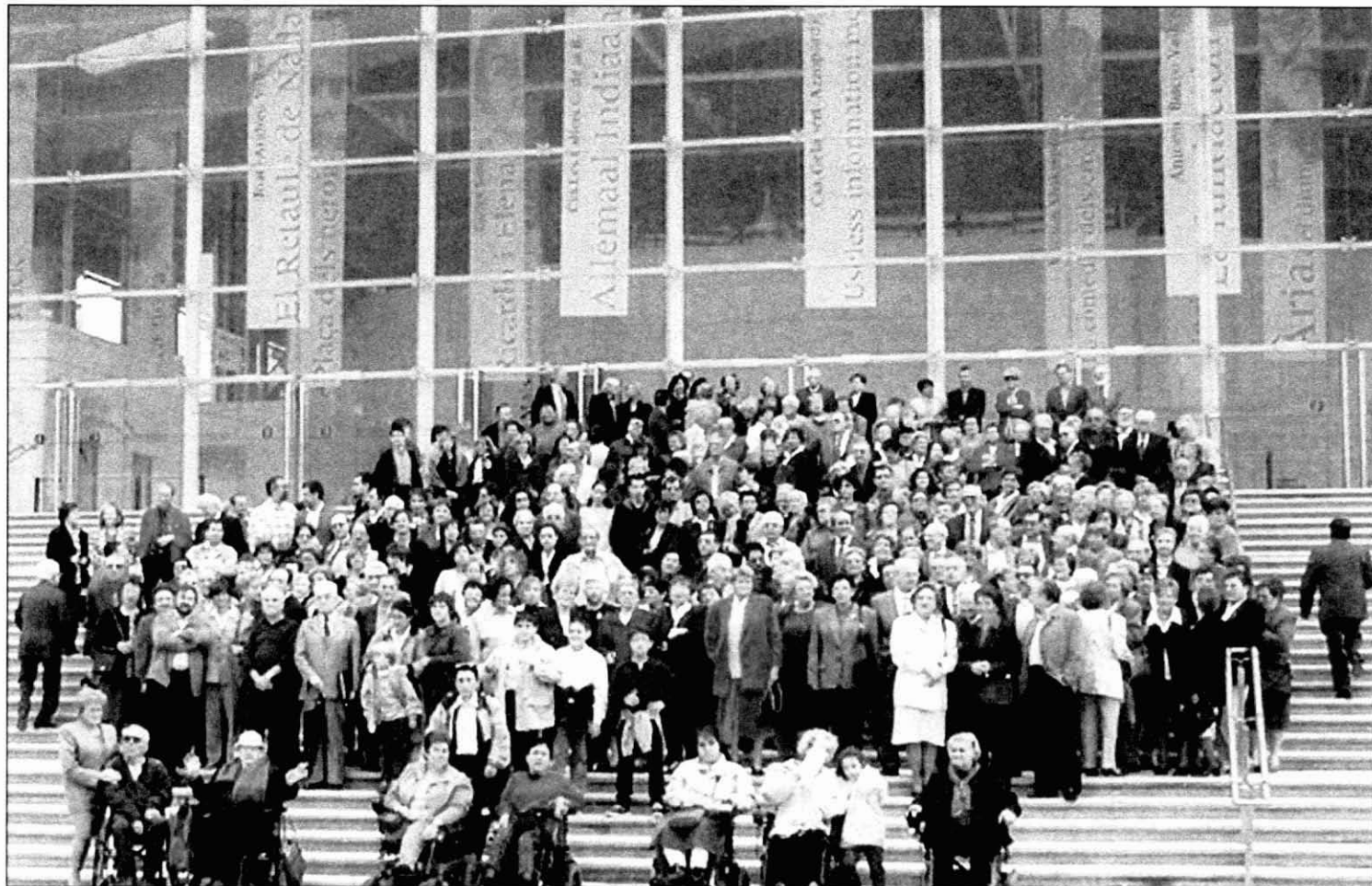
Assistents a la representació de La barca nova al TNC.