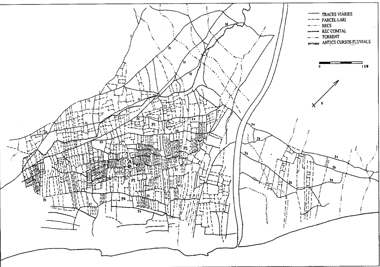
Fig. 2. Estructura parcel·l·ària del delta del riu Besòs, restituida a partir de cartografia cadastral de mitjan del segle XVIII a mitjan del segle XIX.