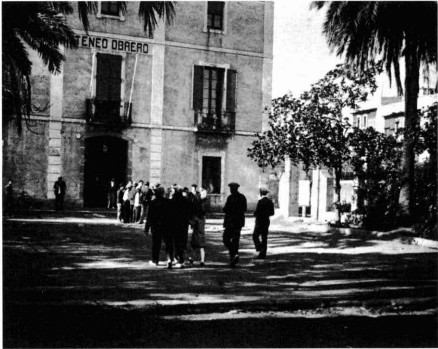
Entrada a les escoles de l'Ateneu Obrer.