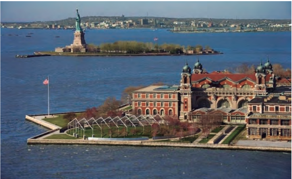
L'Illa d'Ellis en primer pla amb la Estàtua de la llibertat al fons

La visita al Museu de la Immigració transcorre pels edificis restaurats de l'antiga estació marítima: les majestuoses sales on esperaven els immigrants, les lliteres, la gran sala central on es mostren fotografies, cartes, objectes personals i tot tipus de records de l'època. També es poden veure exposicions sobre els controls sanitaris o com els més desafortunats eren deportats. El visitant pot imaginar-se l'ambient i condicions que els immigrants podien viure en aquell temps.