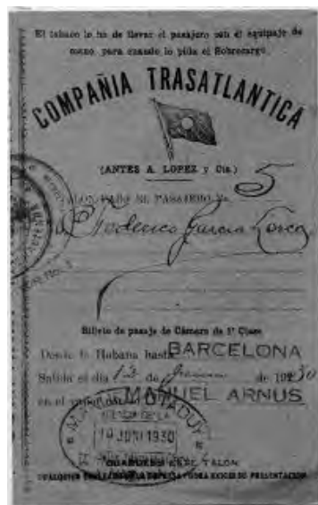
Passatge de García Lorca pel Manuel Arnús