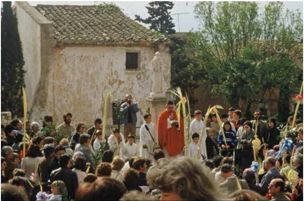
Benedicció de palmes i palmons el Diumenge de Rams per part de Mn Saludes.