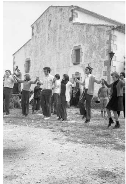
Cal destacar la joventut dels dansaires.