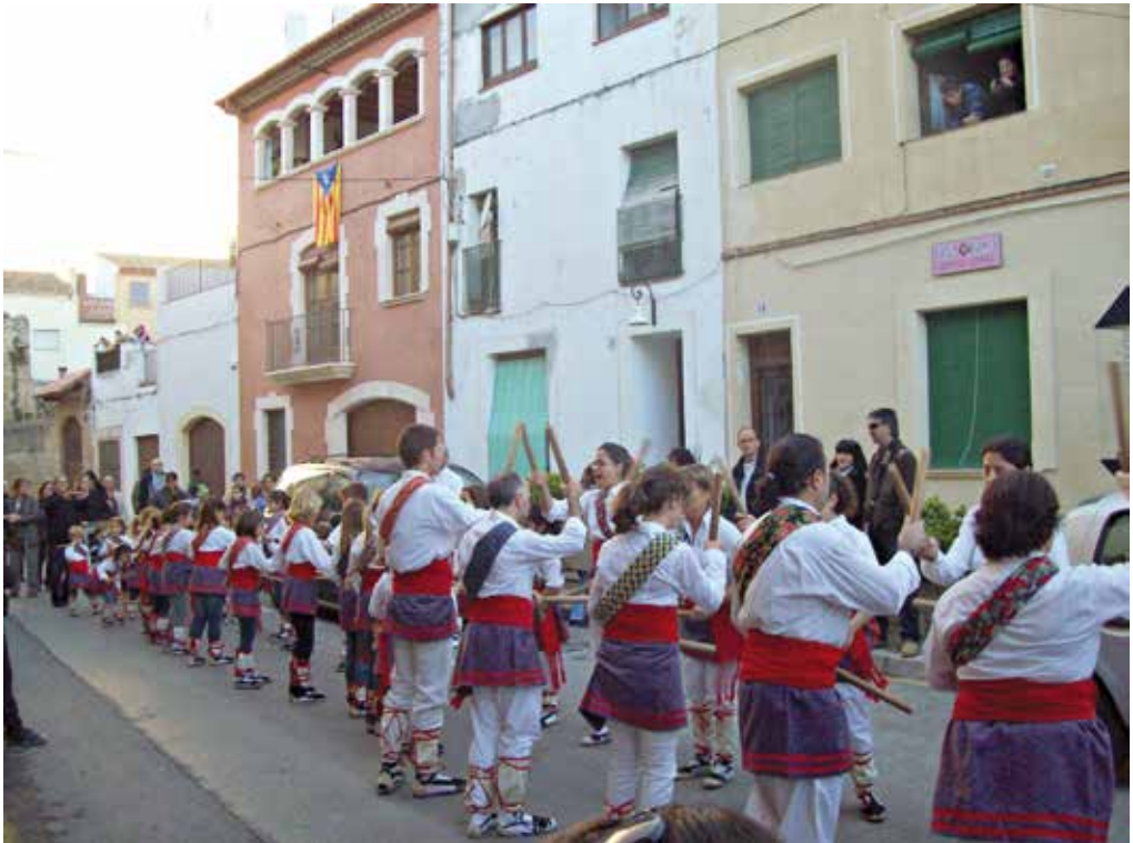
Els Bastoners d'Altafulla també són presents en els actes de l'ermita o en la seva cercavila.