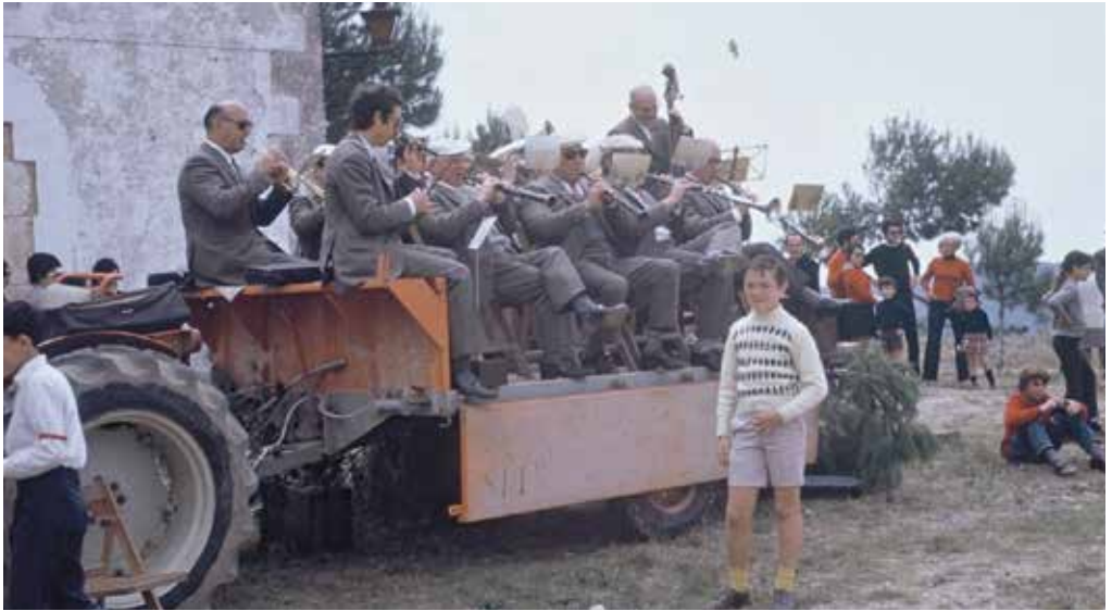
La Cobla, dalt de l'entarimat mòbil de l'època.