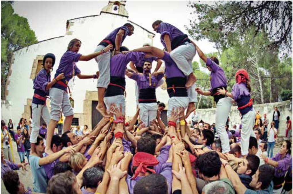
Terços amunt. Els castellers altafullencs, en les actuacions dalt a Sant Antoni.