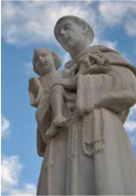
Escultura de marbre blanc a la plaça de Sant Antoni.