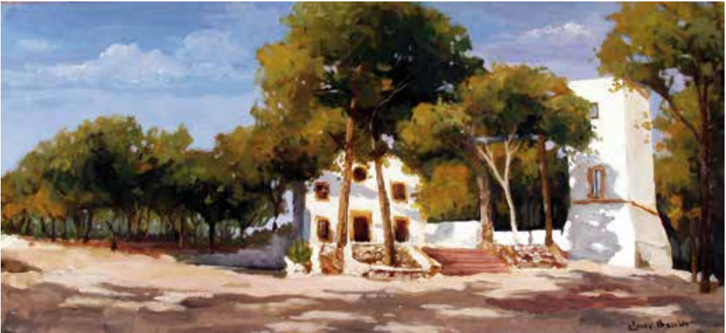
Quadre pictòric de Josep Bellido.