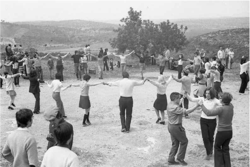
Ballada dels primers aplecs. A dalt a Sant Antoni encara no s'hi havien plantat els pins ni hi havia els dipòsits municipals. A la dreta, el Balcó.