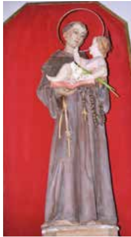
Imatge escultòrica de Sant Antoni.