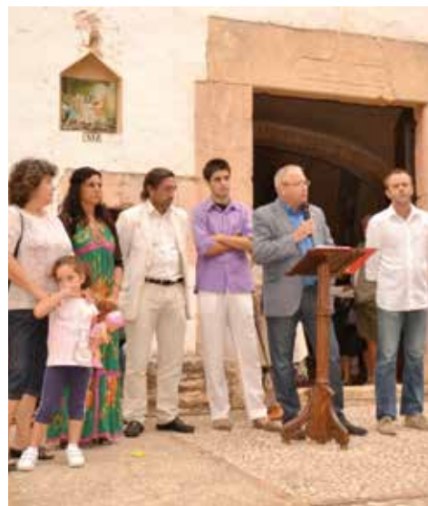
Els parlaments dels nostres representants en el Consistori, l'any 2013 (any de la Via Catalana, que obra pas al procés sobiranista).