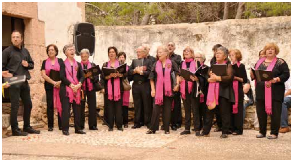
La Coral Nous Rebrots, arrancant el Cant dels Segadors l'any 2013.