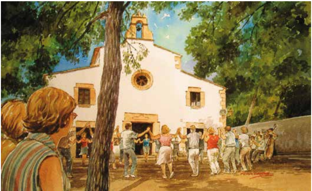
El món dels artistes, com ha fet l'aquarel·lista Fermí Carré, ens reflecteix l'esperit serè, harmònic i primaveral de moltes sardanes.