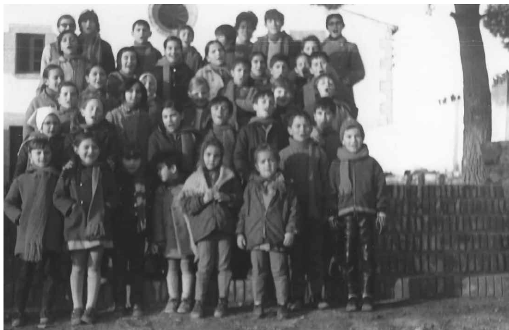
Coral infantil d'Altafulla, desembre de 1970.