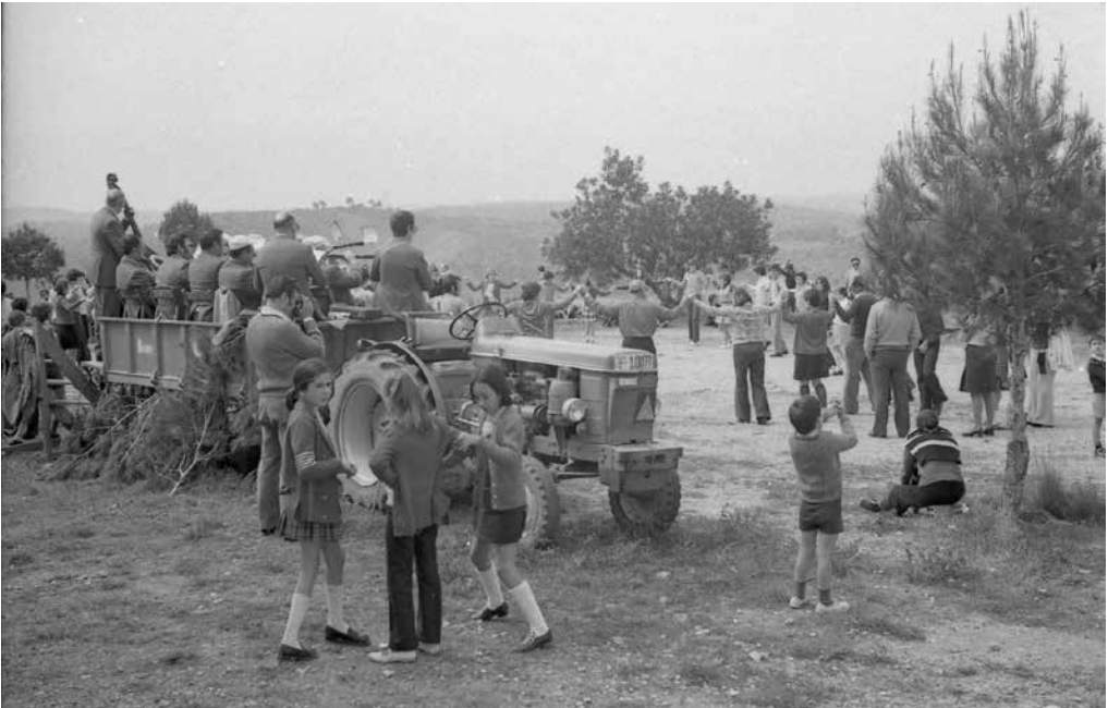
Dilluns de Pasqua any 1973. 1r aplec de sardanes amb la cobla tocant damunt l'estrada feta amb el remolc del tractor.

Actualment, el Dimarts de Pasqua, en acabar la missa es canten els goigs, es venera la relíquia i a la plaça es ballen sardanes. A la tarda es resa el rosari i es menja la mona. Ah!, i no hem d'oblidar la tradició de comprar la mida (cinta de color, que inicialment era de la llargada del sant, beneïda).