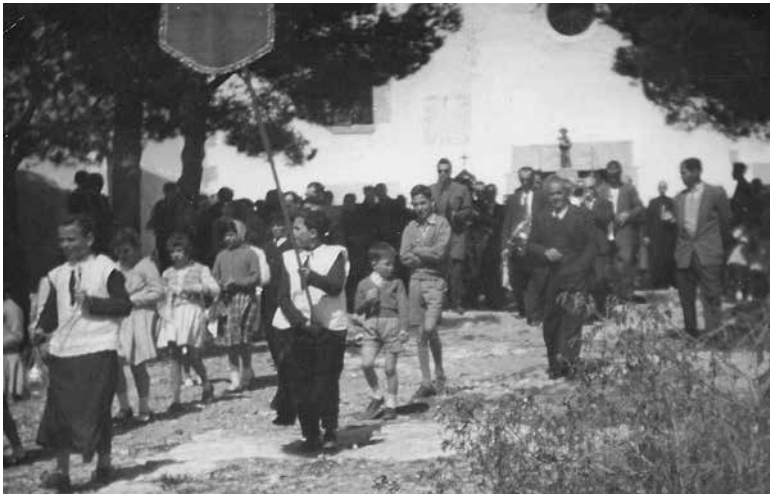
Processó de Dimarts de Pasqua de l'any 1957.

Alguns dies abans de les festes un grup de voluntaris anava a arreglar el camí allà on l'havien malmès les pluges per tal que poguessin pujar els carros. Reomplien les rases amb picadís de la pedrera que hi havia on és ara la plaça de la Pedrera.