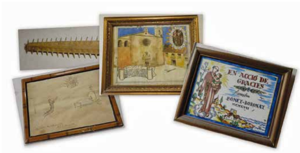
Exvots penjats a la sagristia de l'ermita.