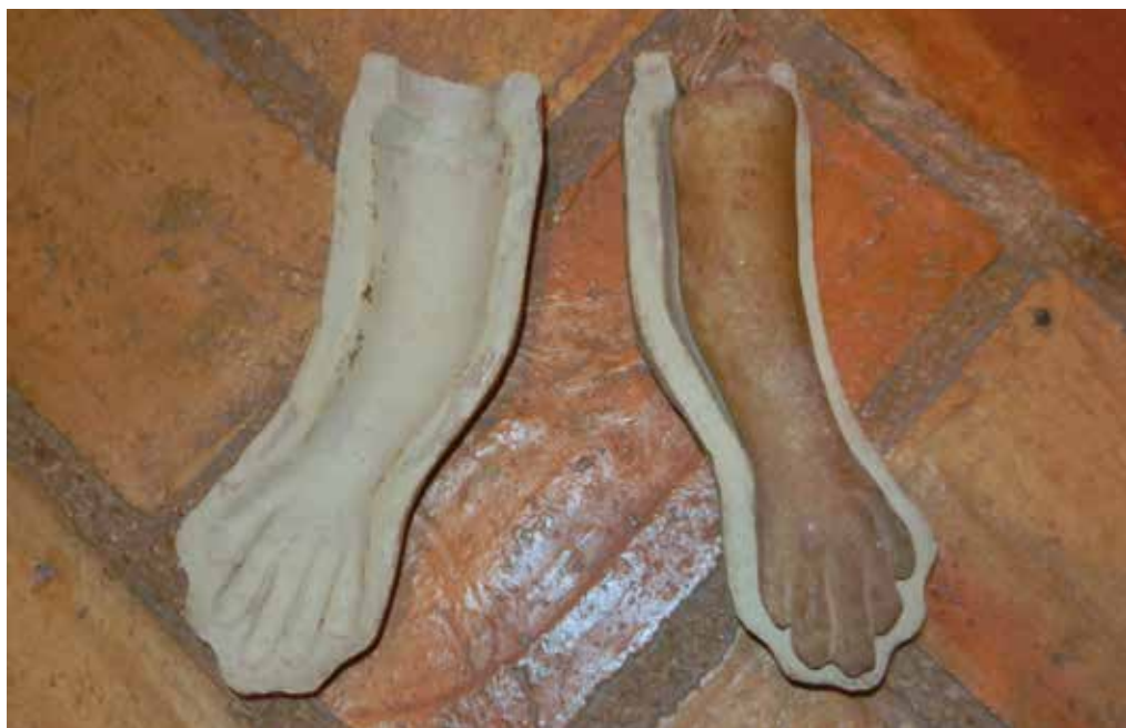
Motllo per fer exvots de cera de la botiga de Ca Punsoda (Centre d'Interpretació de l'Era del Senyor).