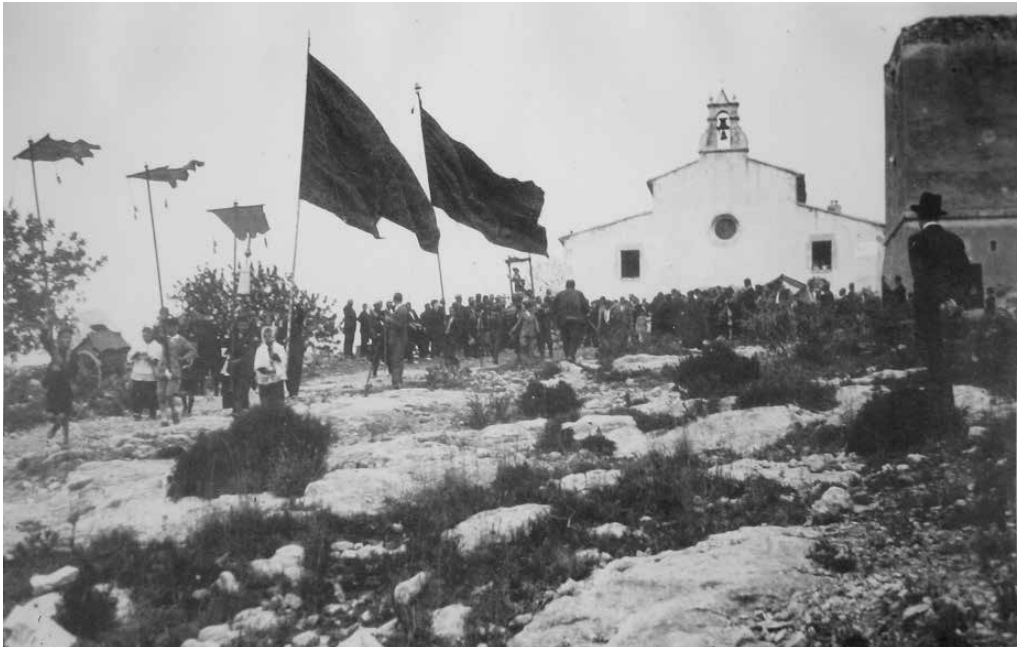
Processó a començaments del segle xx.

Aquest fet és molt antic, però el que encara és record viu dels informants és el que costava pujar a l'ermita els dies de vent. Els pals de les banderes eren molt alts, de manera que es veien des de Ferran i Torredembarra. Aguantar l'abalançada els dies de vent era tota una gesta.