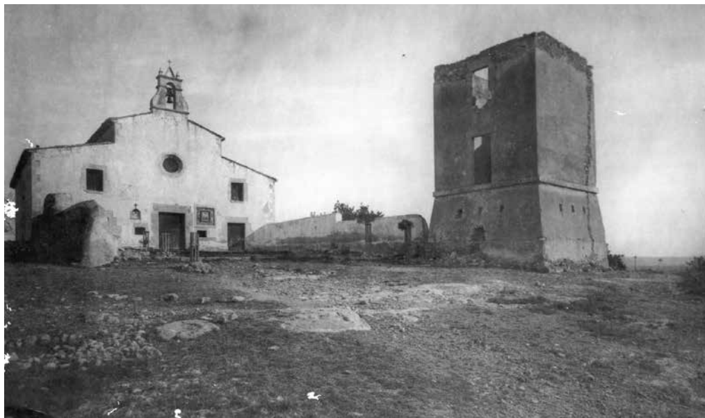
Ermita i torre de Telègrafs a principis de segle xx, poc després que s'hi plantessin els primers pins.

un canteret que ompliren a la bassa del castell i ella i d'altres nens i nenes pujaren aigua per regar els arbres acabats de plantar. L'edat de les criatures situa la festa dos o tres anys més tard, potser el 1925. Però degué ser un fet molt emocionant quan els petits protagonistes ho han transmès amb orgull als seus descendents.