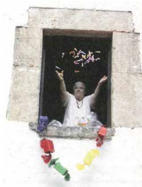
Llençada de caramels després de missa. 11 setembre de 2000.