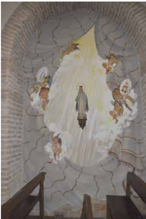
Altar de la Mare de Déu Miraculosa. 1994.