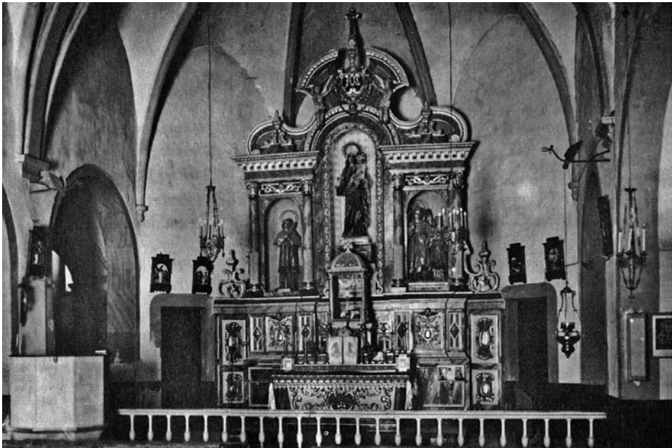
El temple a mitjans dels cinquanta. Raymond.