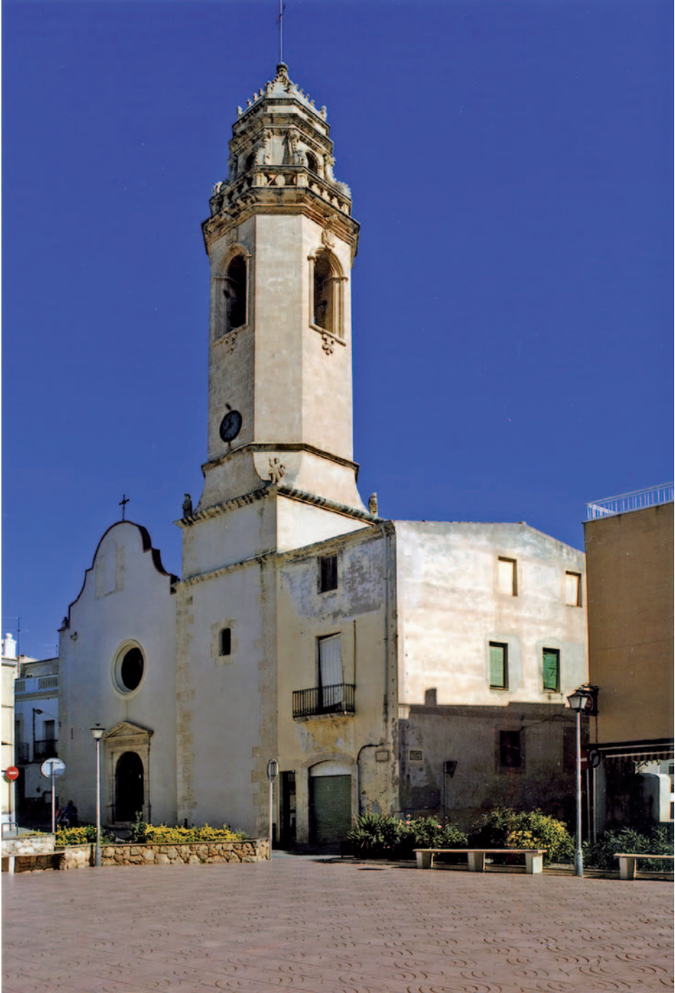
L'actual església amb la rectoria i la plaça sorgida. A. Roca.