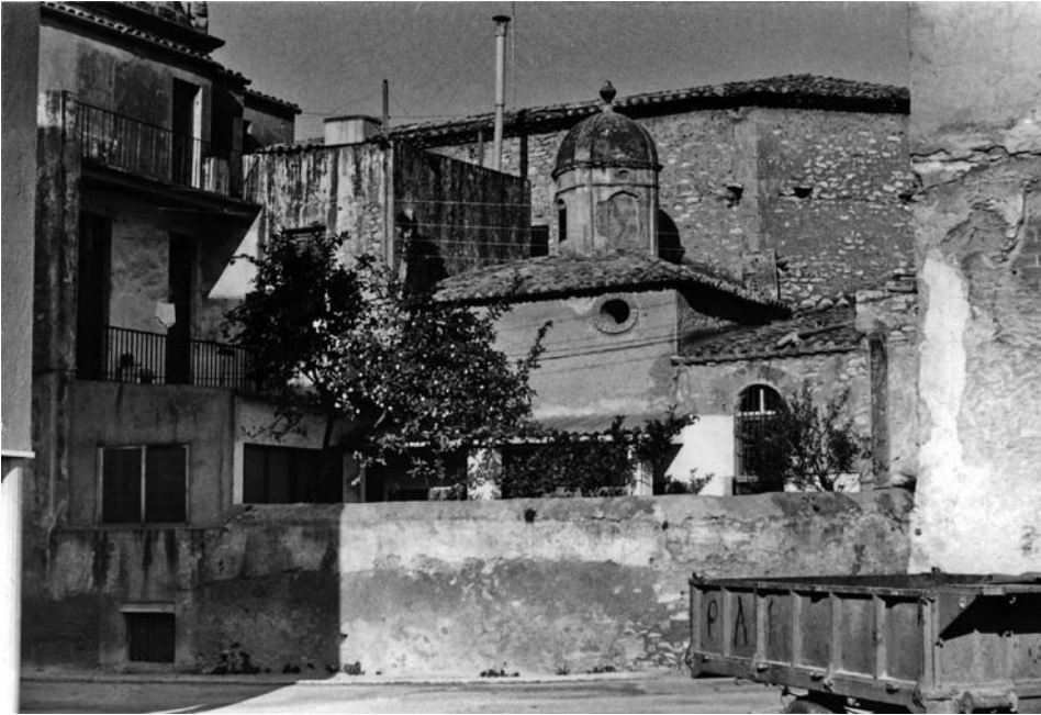
Vista exterior. La sagristia, cap el jardí, capella de la V. de Montornès i part de l'Abadia. J. Morant.