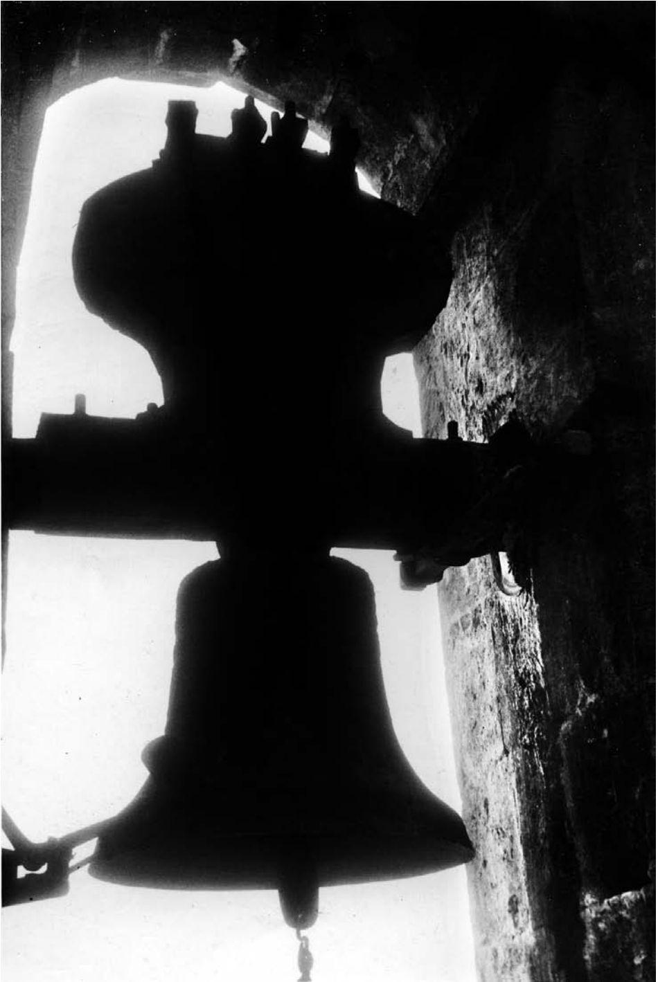
La campana petita va ser la que quedà després del 1936. J. Morant.