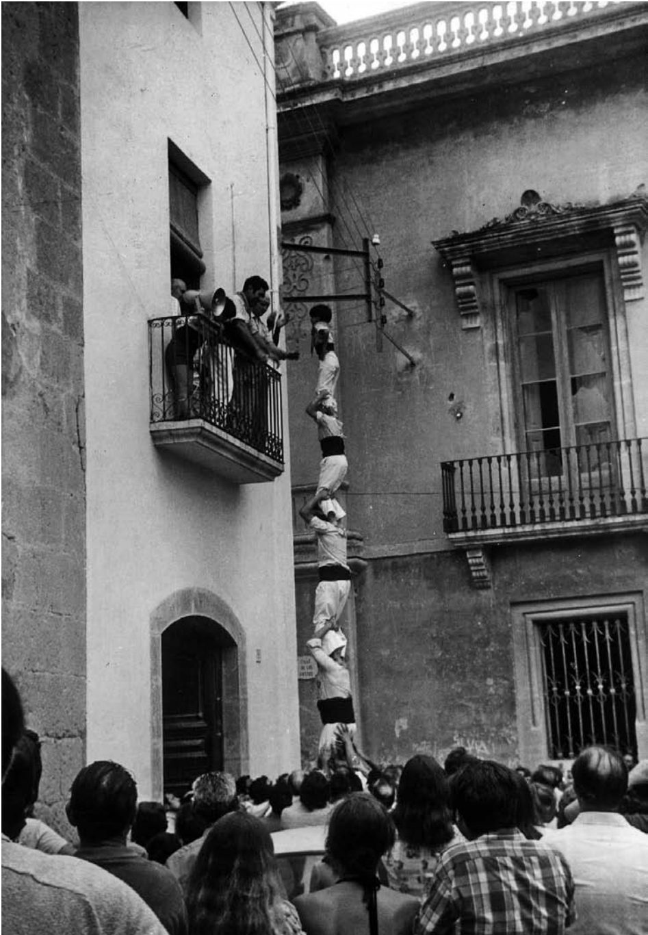
1974. La casa del Rector en pilar de cinc. En mala hora s'enderrocà l'imponent casa pairal de cal Rovira- J. Morant.