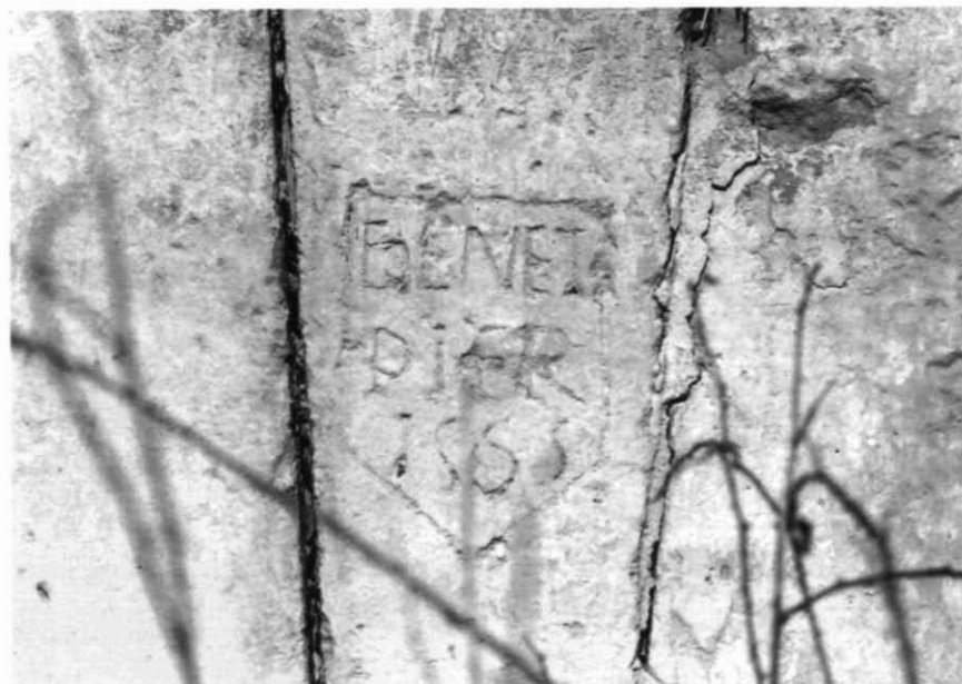
Molí del Pier. Salomó. Dovella porta d'entrada.