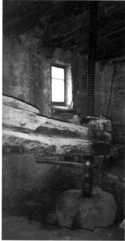
Premsa de lliura de Cal David. Salomó.