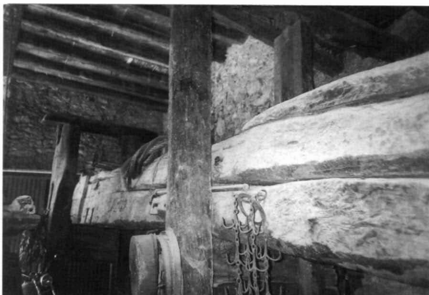
Premsa de lliura de Cal David. Salomó.