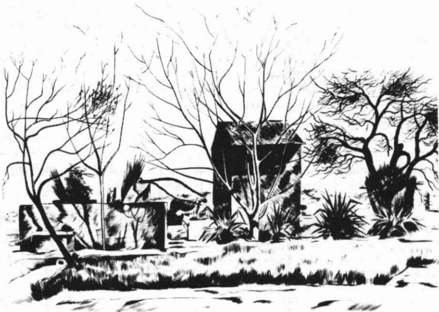
Del Camp de Tarragona.