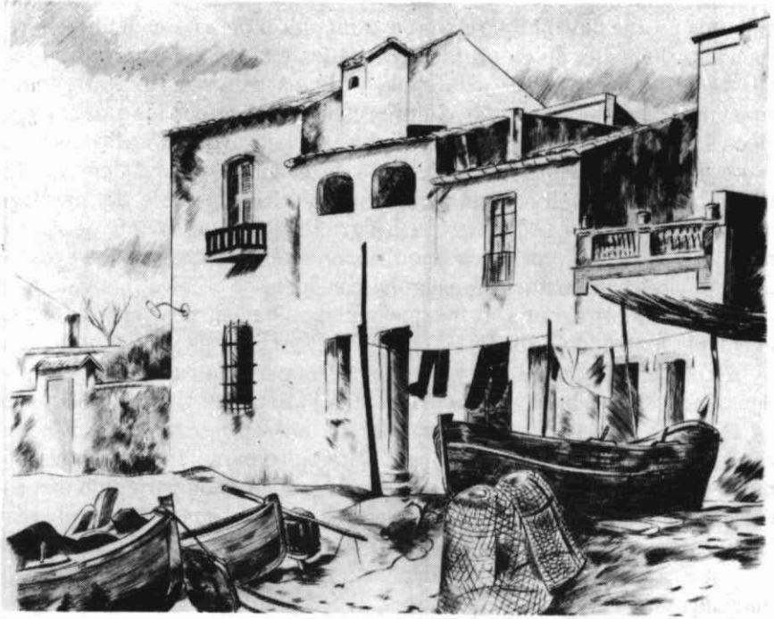
Cases a la platja.