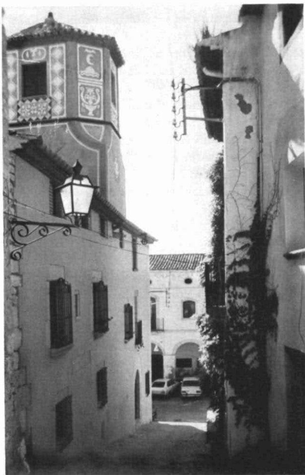
Casa pairal dels Vives, façana del carrer del Forn, d'Altafulla.