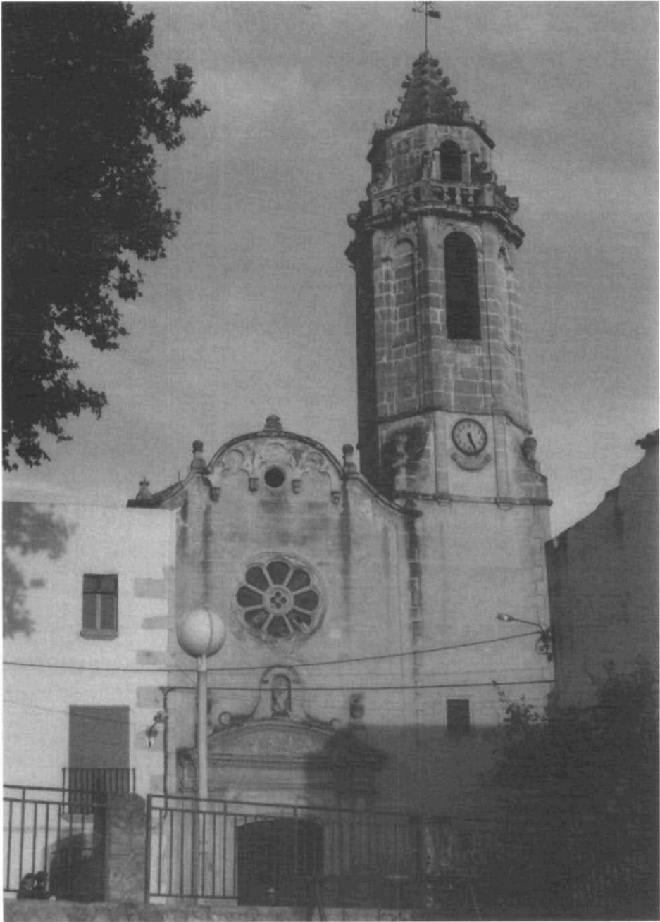
Façana de l'església