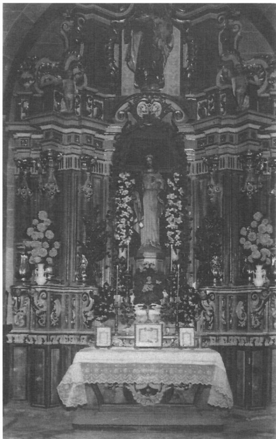
Altar del Sagrat Cor