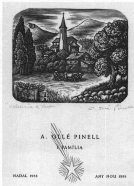
Catàleg núm. 116