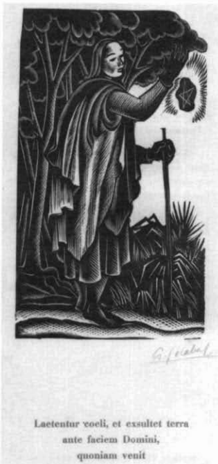
Catàleg núm. 9 i 9 bis