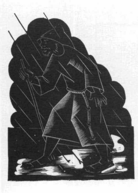
Catàleg núm. 34