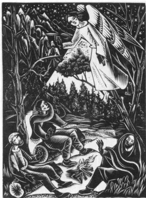
Catàleg núm. 45