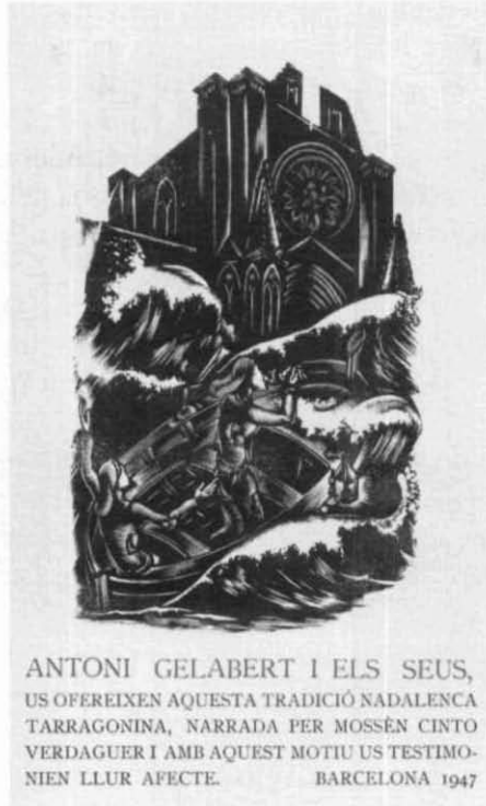
Catàleg núm. 36