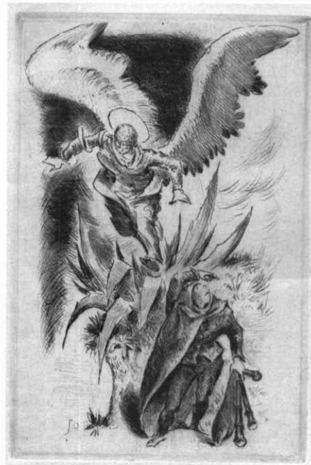
Catàleg núm. 93