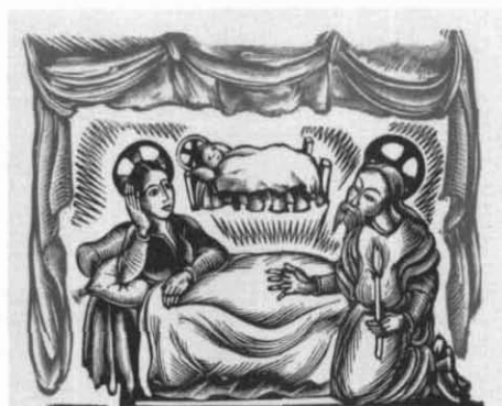
Catàleg núm. 39

PEL NADAL QUE CLOU L'ANY SANT DE M C M L