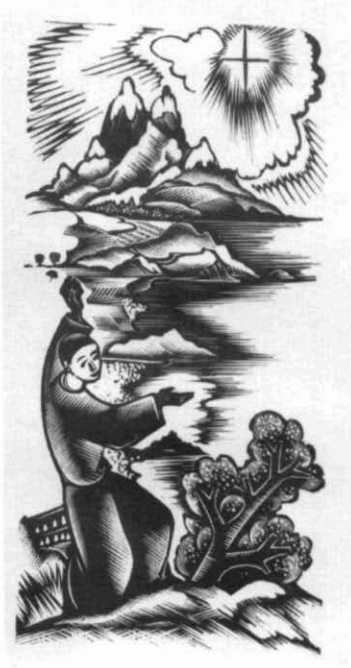
Catàleg núm. 10