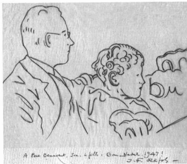
Catàleg núm. 81