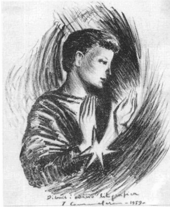
Catàleg núm. 117