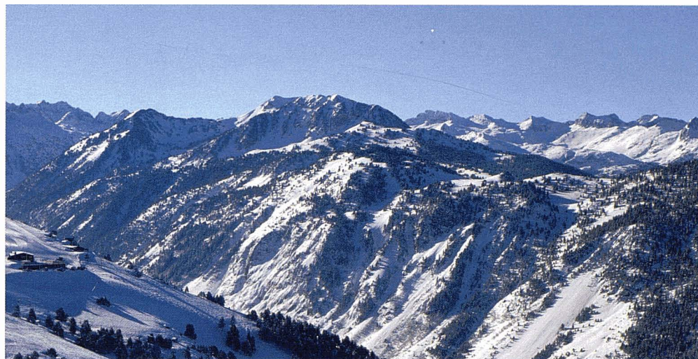
Prats de pastures de Prullans (Cerdanya). Toni Vidal, DG de Turisme, Departament de Comerç, Turisme i Consum