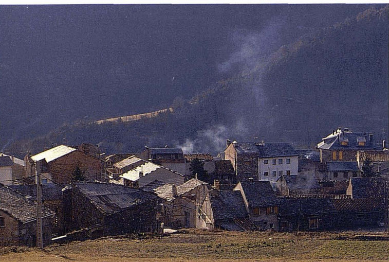
Vista de Planoles. Jordi Pareto, DG de Turisme, Departament de Comerç, Turisme i Consum

Per a nosaltres, el concepte de paisatge tindria fortes coincidències amb la formulació de Turner et al. , a l'entorn del marc conceptual del LUCC, ja que seria un híbrid, millor dit el resultat de l'equació: les forces inductores de caràcter biofísic, de les quals sorgeixen les denominades cobertes del sòl, menys les forces inductores de caràcter socioeconòmic, és a dir, l'apropiació i el usos del sòl. El resultat és allò que s'expressaria en el paisatge com expressió final d'un procés assaonat de complexitat