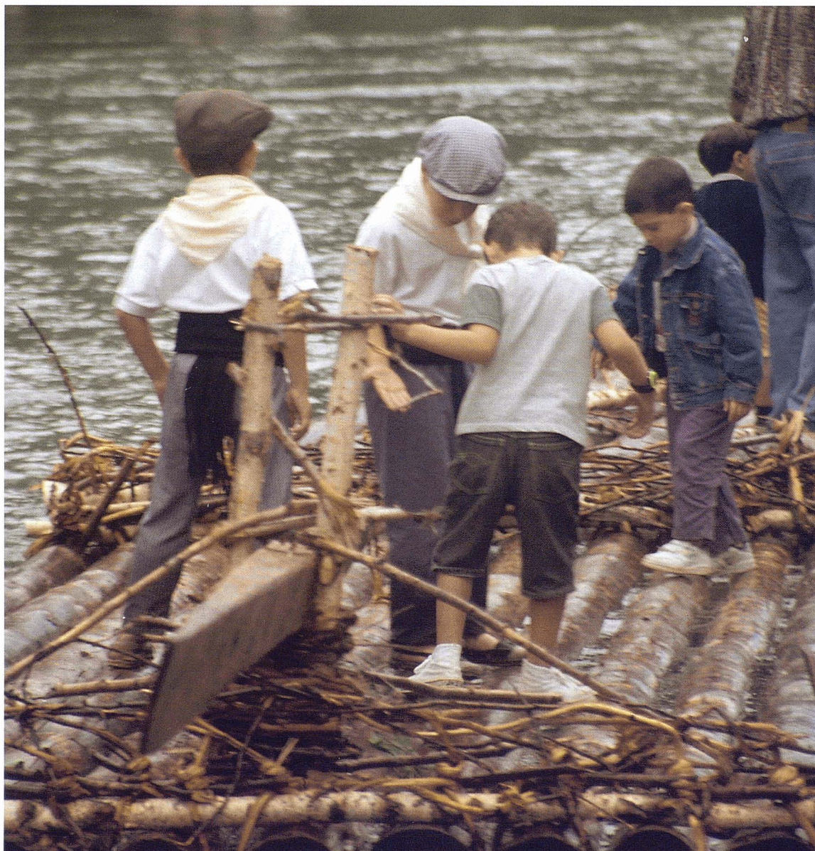
Festa dels rais. J. Abella (EVA)

tècnic de Cultura del Consell Comarcal de l'Alt Urgell