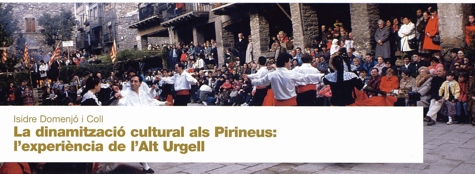
Festa de l'arròs a Bagà.