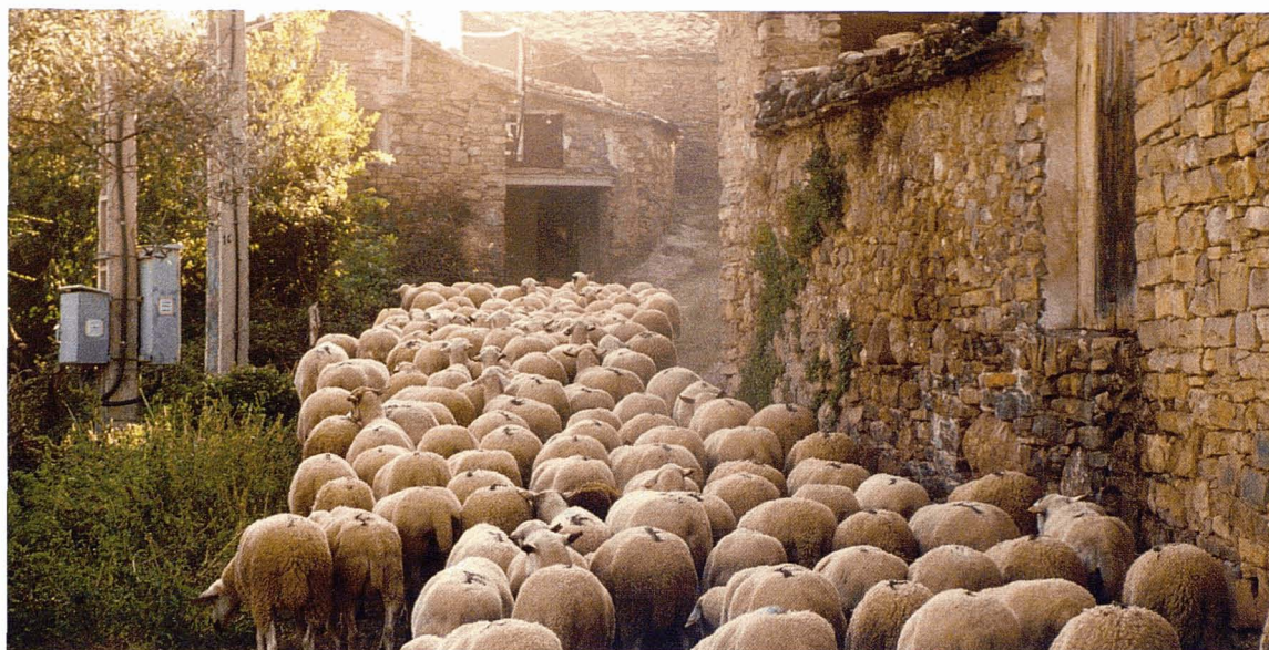
Ramat transhumant a Erinyà.

Intensificació i abandó ens porten inconscientment a recuperar un grau d'organització mínima de l'espai pirinenc, de manera que la població arribi a uns mínims crítics sense els quals resulta gairebé impossible animar qualsevol forma de recuperació paisatgística o de producció estable, per a les quals es requereix una bona dosi d'optimisme i de mà d'obra jove.