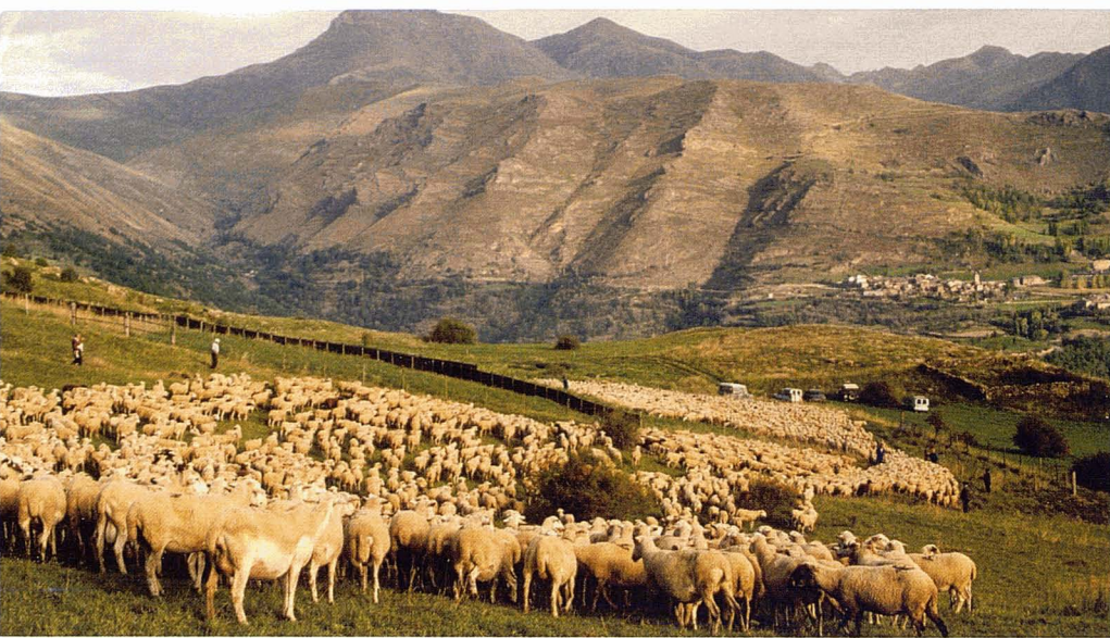
Tria del bestiar per Sant Miquel a la muntanya de Saurí. F. Miralles

La idea inicial de seleccionar ambients amb un indiscutible interès com a ecosistemes ben diferenciats en perill de desaparèixer i susceptibles de ser protegits és la que s'ha anat estenent des dels primers temps dels parcs nacionals espanyols ( Parcs Nacionals , 2002). Potser el fet de considerar-los conjuntament amb els seus entorns, és a dir, atribuint cada cop més protagonisme als pobles i explotacions veïnes, és una nova filosofia que ens pot portar per dos camins ben interessants. Per una banda permetrà no seguir ampliant més superfícies per protegir, ja que les inversions són molt altes i no es poden mantenir com a territori-illa on cal un esforç regulador exagerat i, per l'altra, pot anar organitzant cercles de protecció perifèrics a cada nucli de les reserves. En aquests nous territoris d'influència dels parcs, amb un pes ja molt important de les poblacions i de les seves formes d'explotació de l'entorn, es pot anar passant de les figures de protecció estricta a d'altres de promoció rural amb un sentit clar d'un bon balanç entre explotació i conservació. De fet seria organitzar amb un llenguatge nou (potser dins de l'estil de les agendes 21 locals) les pautes d'explotació que permetessin incorporar-hi la conservació com una activitat més però amb un grau de sostenibilitat molt ben consensuat.