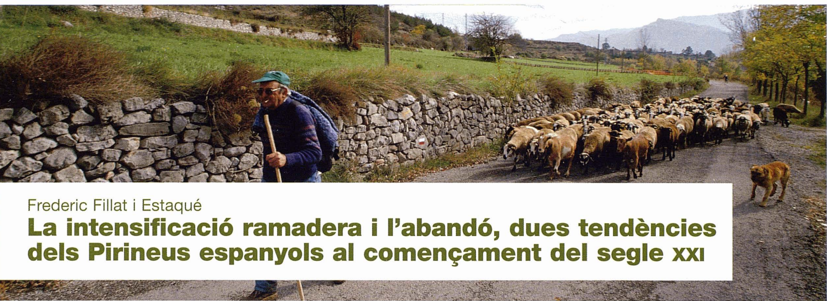
Pastor amb el seu ramat a Bagà.