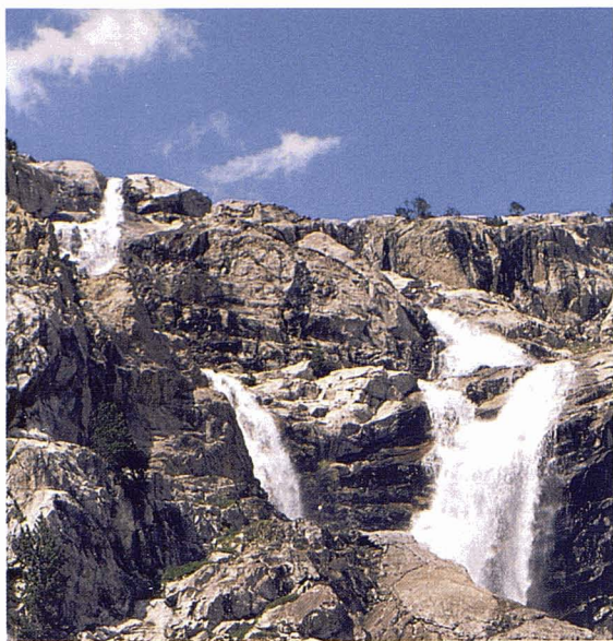
L'abundància d'aigua superficial condiciona les possibilitats ramaderes d'estiu. F. Fillat

cen. Fa ben pocs anys, les taules de snow-board han anat captant nous clients per a altres formes de descens. Esport i moda han arribat a l'actual diversitat de vestuaris de pista o de nit que complementen l'atractiu de la neu amb les reunions de negocis o de curtes vacances d'entre temps.