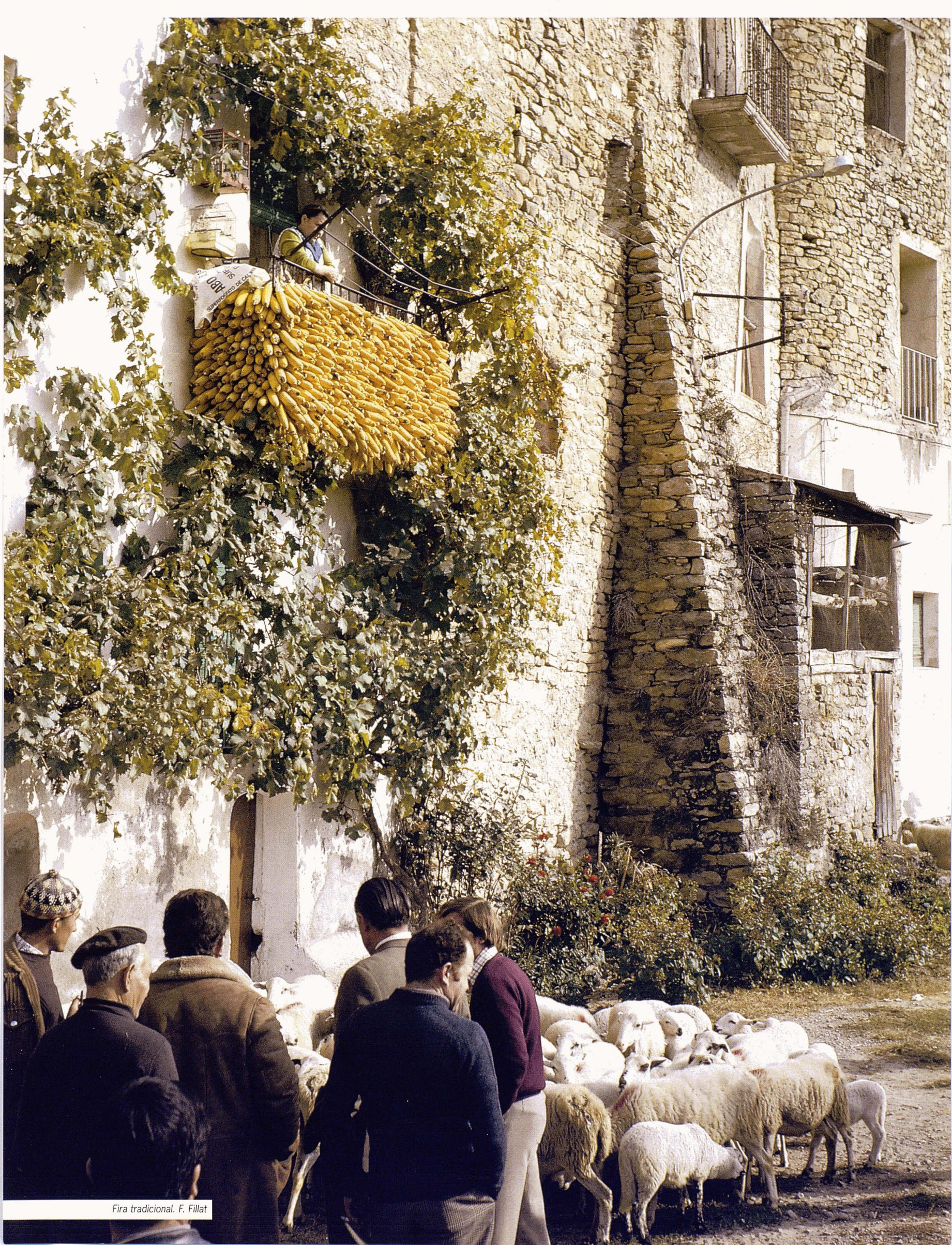
Fira tradicional. F. Fillat