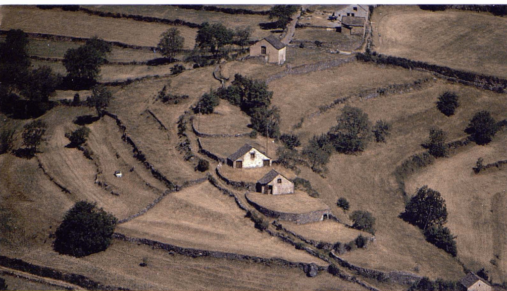
La superpoblació de l'edat mitjana va anar dividint camps als vessants de solana. F. Fillat

acabar en tractats de pau fets fins i tot amb veïns francesos i es generalitzaren cap al segle XIII; després foren exhibits als diferents senyors feudals i reis perquè en confirmessin els drets de propietat fins als nostres dies (Tucco-Chala, 1965). Els drets comunals sobre les pastures d'estiu de molts pobles de muntanya són, doncs, un document històric que es podria considerar tan important com l'església romànica més bonica o com les talles de fusta més elaborades i ben guardades d'alguns poblets de muntanya.