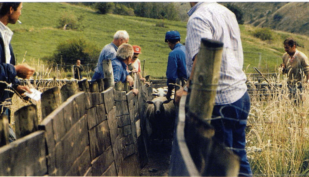
Sant Miquel és la data tradicional en què els ramats abandonen la muntanya. F. Miralles