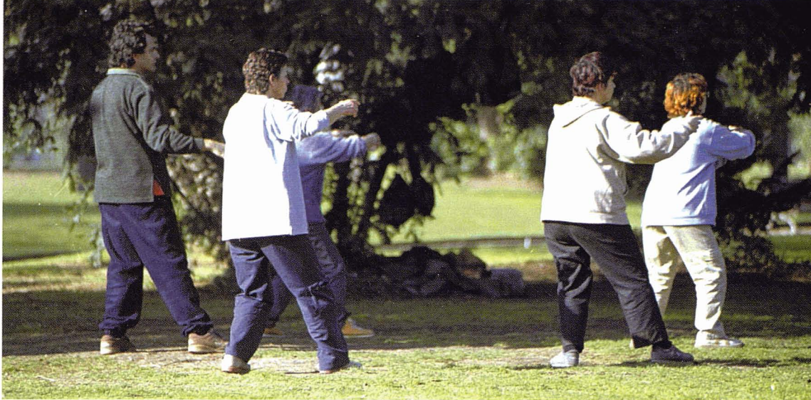
Parc de la Ciutadella de Barcelona. R. Moreno

natural (d'hàbitats, d'espècies i genètica). En altres tesselles, s'incrementa molt la intervenció humana, potser amb una elevada riquesa cultural o potser amb una ocupació molt simplificadora del medi en tots els aspectes. Entre uns extrems i altres, hi ha totes les situacions intermèdies. El que hem d'intentar és, en primer lloc, saber quin país volem, és a dir, quins grups d'objectius d'ús han de dominar a cada part del país, i, en segon lloc, que les intervencions humanes, sigui quina sigui la seva intensitat, estiguin tan ben pensades com en siguem capaços, en totes les dimensions, i una dimensió molt important és l'ambiental. Hem de compatibilitzar molts usos, com hem vist en el cas dels parcs metropolitans, però compatibilitzar vol dir d'antuvi respectar els diferents interessos i trobar la millor solució.