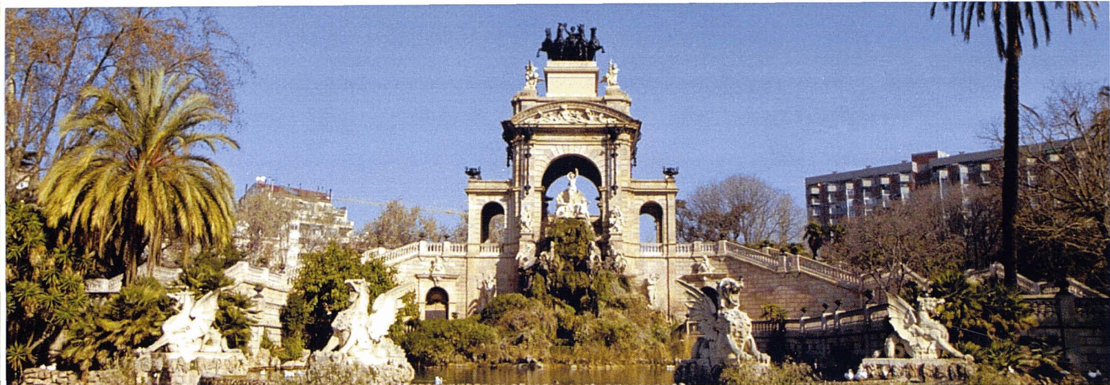
Parc de la Ciutadella. R. Moreno