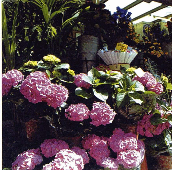
Rambla de les Flors de Barcelona. R. Moreno