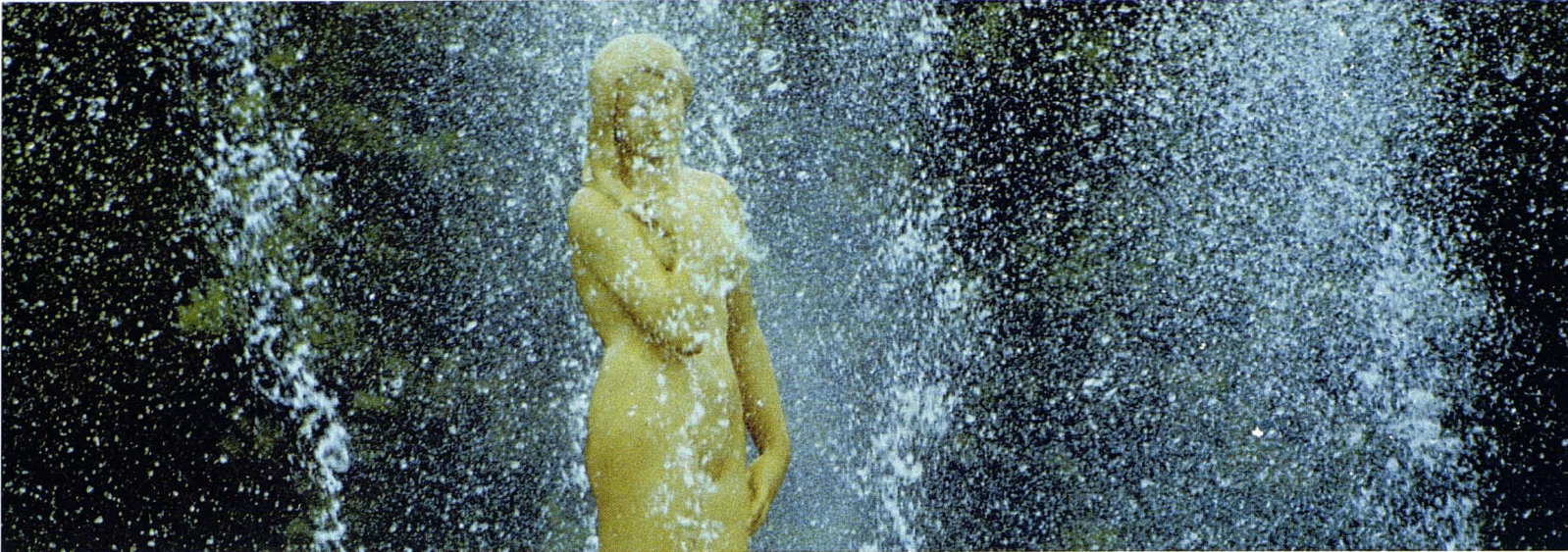
Font de Montjuïc. R. Moreno

en certa manera, veuen imposats per un canvi d'actituds socials en relació amb la natura.