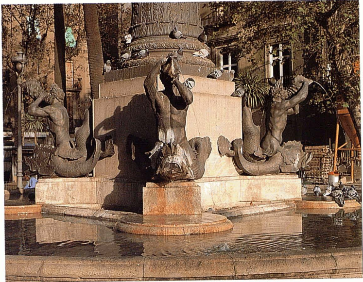
El basament és format per un estany circular de pedra de Montjuïc, al centre del qual s'erigeix un cos poligonal que sosté quatre tritons.

Com ja hem dit, Andreu Avellí Pi i Arimon també criticà la dedicació del monument a Marquet, alhora que assenyalava que el públic de Barcelona no havia estat informat degudament sobre la identitat del personatge, ni per mitjà d'uns apunts biogràfics, ni