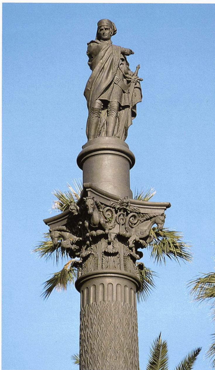
L'estàtua de Galceran Marquet, vice-almirall de Catalunya i conseller de la Barcelona baix-medieval, va ser el primer monument realitzat de ferro colat a Barcelona, un símbol de progrés a mitjan segle XIX.

L'estàtua de Galceran Marquet, a la plaça del Duc de Medinaceli, va ser el primer monument fet de ferro colat a Barcelona. El conjunt artístic, obra de Damià Campeny, un dels màxims representants de l'escultura neoclàssica de la península, és una mostra singular del medievalisme que havia arrelat en la mentalitat dels artistes catalans a mitjan s. XIX, i la utilització del nou material constructiu va significar un símbol de progrés a la Barcelona d'aquella època.