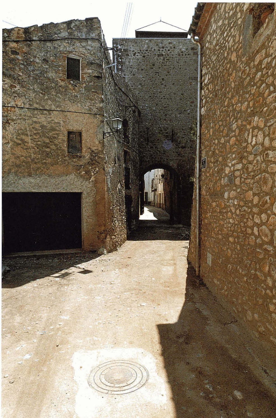
Després de la intervenció

noràvem, però, si la paret actual conservava algun vestigi de la muralla, o si al contrari, era reconstruïda recentement. Aquesta, i la forma originària del coronament de la torre, eren les úniques incògnites significatives que oferia el conjunt.