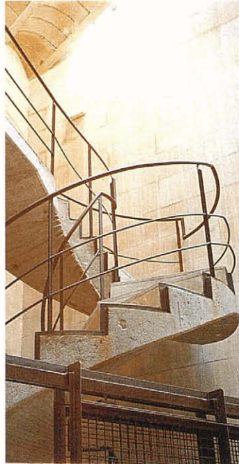
Detall de l'escala helicoidal. A dalt la il·luminació natural rasant sobre el mur lateral

La segona sorpresa, que ha comportat modificacions dignes d'esment respecte de les previsions del projecte, ha estat la del forat existent a la segona volta de la torre, que els defensors usaven en última instància per accedir al terrat. El que en una primera observació, acurada però únicament visual, es prengué per un simple forat, no gaire ben emplaçat des del punt de vista estructural, i que per tant al projecte es plantejava de tancar i substituir per un de nou al centre de la volta, resultà ésser una obertura feta amb carreus escairats per la part de sota, i amb esglaons per la de sobre; els uns i els altres havien passat desapercibuts en la primera observació a causa de la gran quantitat de bardisses que hi havien crescut, i varen aparèixer quan les bardisses van ser estassades. La conveniència d'aprofitar aquella obertura no va ésser dubtada ni un moment, i això va significar d'abandonar la previsió del projecte de fer una escala única de cargol centrada a la planta, que sortia a nivell del terrat, també al centre. L'escala que s'ha executat té més riquesa formal de la prevista, i alhora ofereix un recorregut més suggeridor, que s'inicia en una posició equidistant de totes les parets, però que fa necessària l'aproximació i el seu contacte per aconseguir de superar l'últim tram. L'arribada a