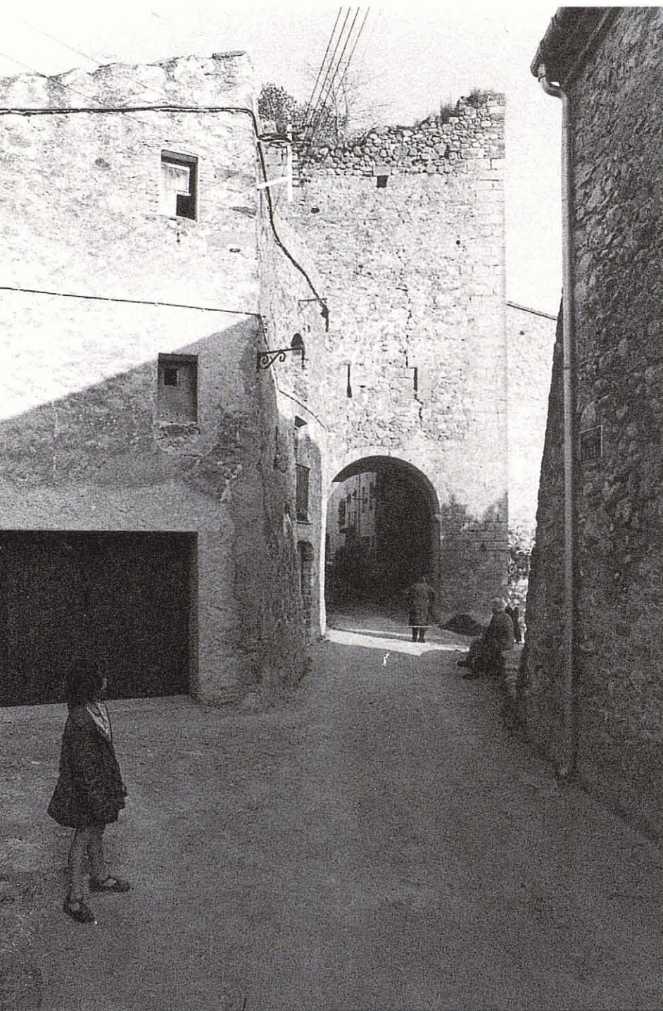
El portal de Dalt i la seva torre vistos del camí d'Albanyà estant, per la part de fora Abans de la intervenció

De la revolució industrial ençà, l'antiga glòria i riquesa de Sant Llorenç, que havia arribat a tenir, a més de la ja esmentada fàbrica d'armes, un hospital, un notari i un mercat setmanal concedit pel rei En Jaume, va minvar progressivament amb la mateixa regularitat