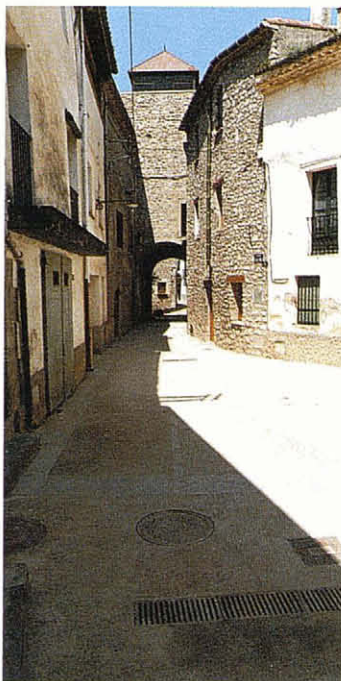
El Portal de Dalt, del cantó de dins de la vila estant. En primer terme, la pavimentació del carrer, part del mateix projecte.

En arribar al nivell desitjat una passarella també exempta serveix per a salvar la distància entre la torre i la vertical de l'escala.