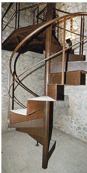
Del primer pis de la torre arrenca una nova escala, de cargol, que s'enfila cap a la volta.

eventualitat sempre present als projectes de rehabilitació o restauració de construccions antigues, que per raó del caràcter públic dels promotors habituals són precisament les que estan subjectes a la legislació de contractes de l'estat. És per això que seria bo d'arbitrar un mecanisme que permetés de gestionar una part dels crèdits habilitats inicialment, en fase de projecte, per endegar una investigació prèvia que en alguns casos hauria d'ésser una autèntica campanya d'excavació arqueològica, i en uns altres una simple operació d'exploració superficial de les fàbriques a restaurar. En tots els casos, això permetria al projectista de treballar sobre dades més certes, i estalviaria sorpreses a l'obra.