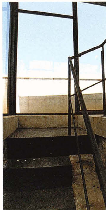
Els toscos graons de pedra d'accés al terrat s'han mantingut, protegits pels nous, de xapa de ferro.

dalt, com que no és centrada, ha obligat a desplaçar lleugerament l'estructura metàl·lica de la coberta, i a abandonar, la planta octogonal que hi preveia el projecte. Aquest últim aspecte fa que sigui encara més mimètica respecte del campanar de l'església, seguint per tant les intencions del projecte.