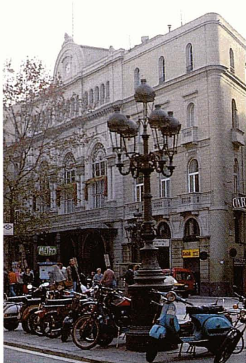
El Teatre del Liceu, d'Oriol Mestres, i la plaça Reial, de Francesc Daniel Molina, són dues obres destacades de la primera meitat del segle XIX.

La casa Milà, més coneguda amb el nom de La Pedrera, és obra de Gaudí, figura màxima de l'arquitectura catalana, que juntament amb la casa Calvet (1898-1900) i la casa Batlló (1904-1906) són una referència imprescindible en l'estil modernista de començament del segle XX.