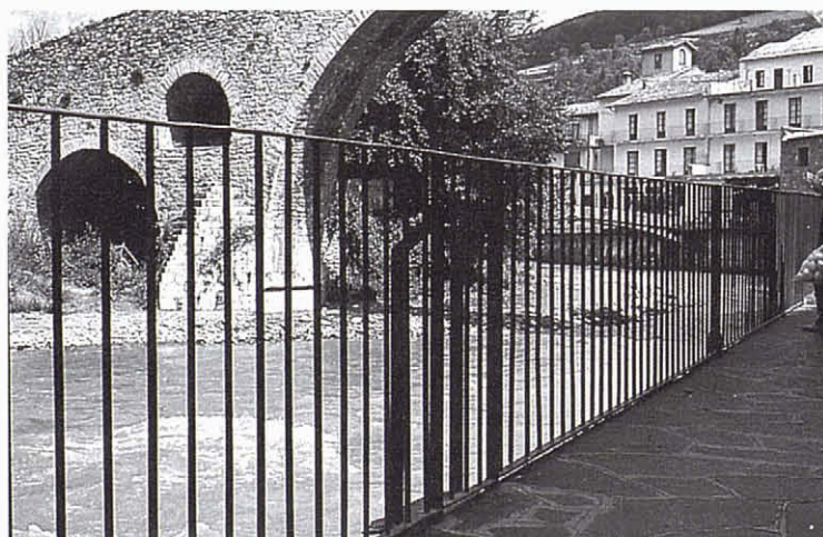
Substitució de les pilastres per trams de barana de ferro amb suports nous (1987).