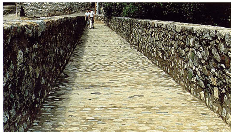
El paviment del passatge superior restaurat (1987).

un costat, i de les instal·lacions de la piscina d'un hotel, per l'altre.