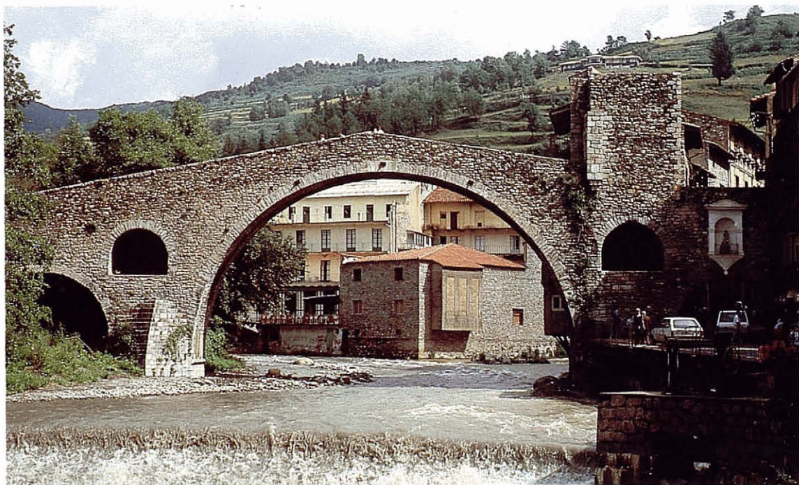
El Pont Nou restaurat (1987).

Actualment, el pont presenta una cara sud bastant completa i una cara nord molt poc visible, a causa del seu carregament contra les cases del carrer de Sant Roc, per