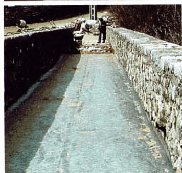
Impermeabilització del paviment del passatge superior.