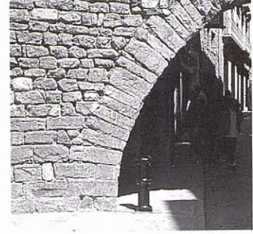
Substitució del postís per un piló de fosa exempt (1987).

Aquesta capella o nínxol devia estar tractada, des de la seva construcció, en una època relativament recent, amb un estuc superficial. De fet, en una fotografia de final de segle passat o començament d'aquest, es distingeix la diferent qualitat i, probablement, el color, de les parts estucades. Les dues pilastres laterals semblen tractades amb imitació de marbre. El quart d'esfera de la cúpula era blau cel, amb estrelletes daurades (això era visible fins a la restauració dels anys cinquanta). Molt recentment, cap a final dels anys cinquanta, l'estuc d'aquesta fornícula va ser suprimit i les pedres de l'obra de la capelleta, encara que d'aparell molt ordinari, van quedar descobertes. Aquest era un tipus d'acció bastant corrent en aquells dies, en recerca de l'«autenticitat» del material. Una espècie d'aliança entre l'art modern, els «valores del règimen» i la Catalunya de botifarra i espartenyà.