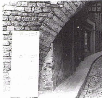
El postís de l'arc de Sant Roc abans de la restauració (1983).