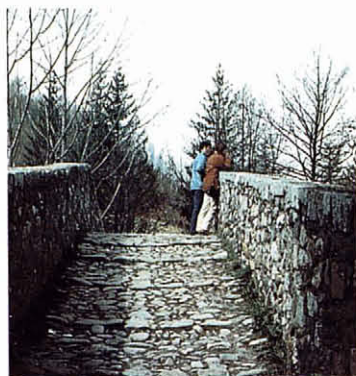
El paviment del passatge superior abans de la restauració (1983).