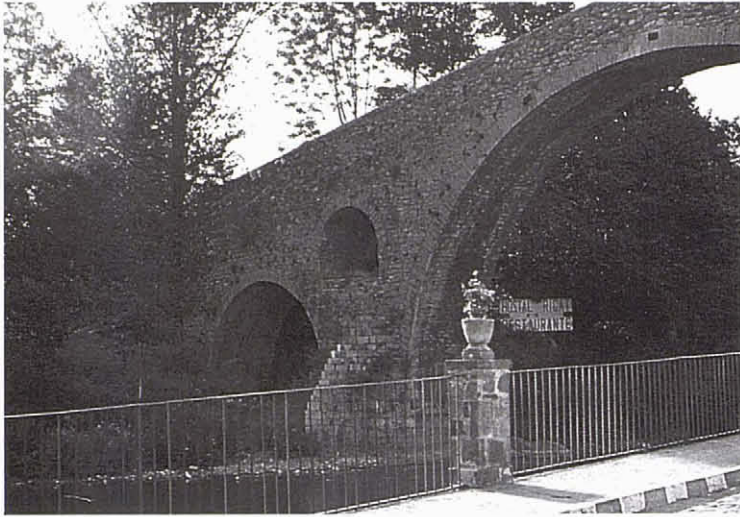
El pont tapat pels arbres. Les pilastres de pedra de la barana inferior que hi havia des dels anys 50.