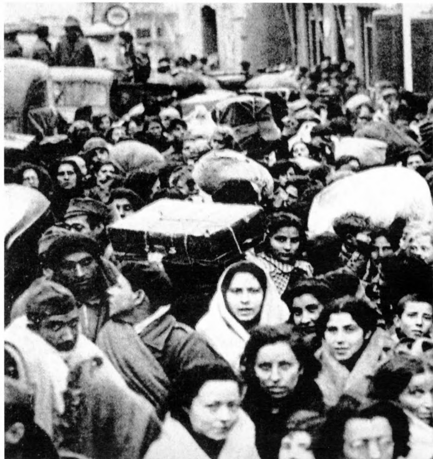
Un allau de refugiats, en direcció a França.