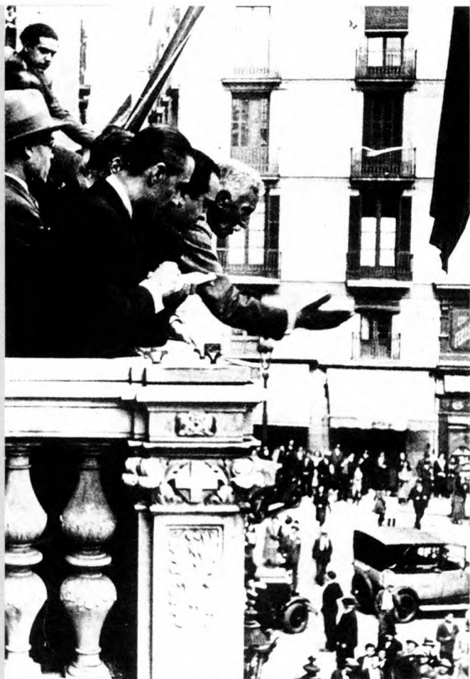
Francesc Macià proclama la República catalana al balcó de la Generalitat.