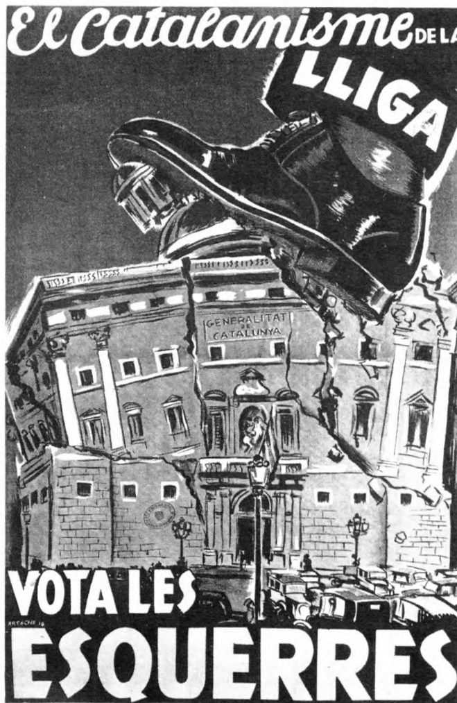
Propaganda del Front d'Esquerres.

dans catalans. Entre elles, la identificació d'anticatalanisme amb conservadorisme. El Front d'Ordre, coalició electoral de la Lliga Catalana amb la Confederación Española de Derechas Autónomas i els radicals de Lerroux, va acabar de brodar el paisatge d'aquell nou imaginari polític. El Front d'Esquerres va guanyar les eleccions del 16 febrer de 1936 i els presos van sortir al carrer, l'Estatut fou recuperat i els ajuntaments van tornar a ser governats pels consistoris democràtics d'abans d'octubre. Però la fractura social era una realitat, les actuacions repressives eren recentíssimes. I si bé és cert que la vida parlamentària catalana va gaudir de calma, la complexa realitat social, no. Ni als consistoris, ni a les fàbriques, ni als tallers ni als carrers. Si el març de 1936 el periodista Manuel Brunet escrivia que potser Ca-