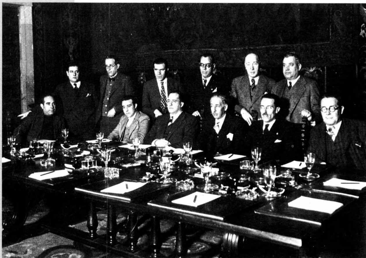
Govern de la Generalitat de Catalunya, el desembre de 1936.

mençava l'ocupació de Catalunya. En un mes entrava a Barcelona, i en quinze dies escassos arribava a la frontera. Manuel Tagüeña, un excel·lent militar, no havia pogut fer res més que anar-se replegant amb un cert ordre. Les queixes dels consellers Joan Comorera: "Catalunya ha aguantat en solitari el pes de la