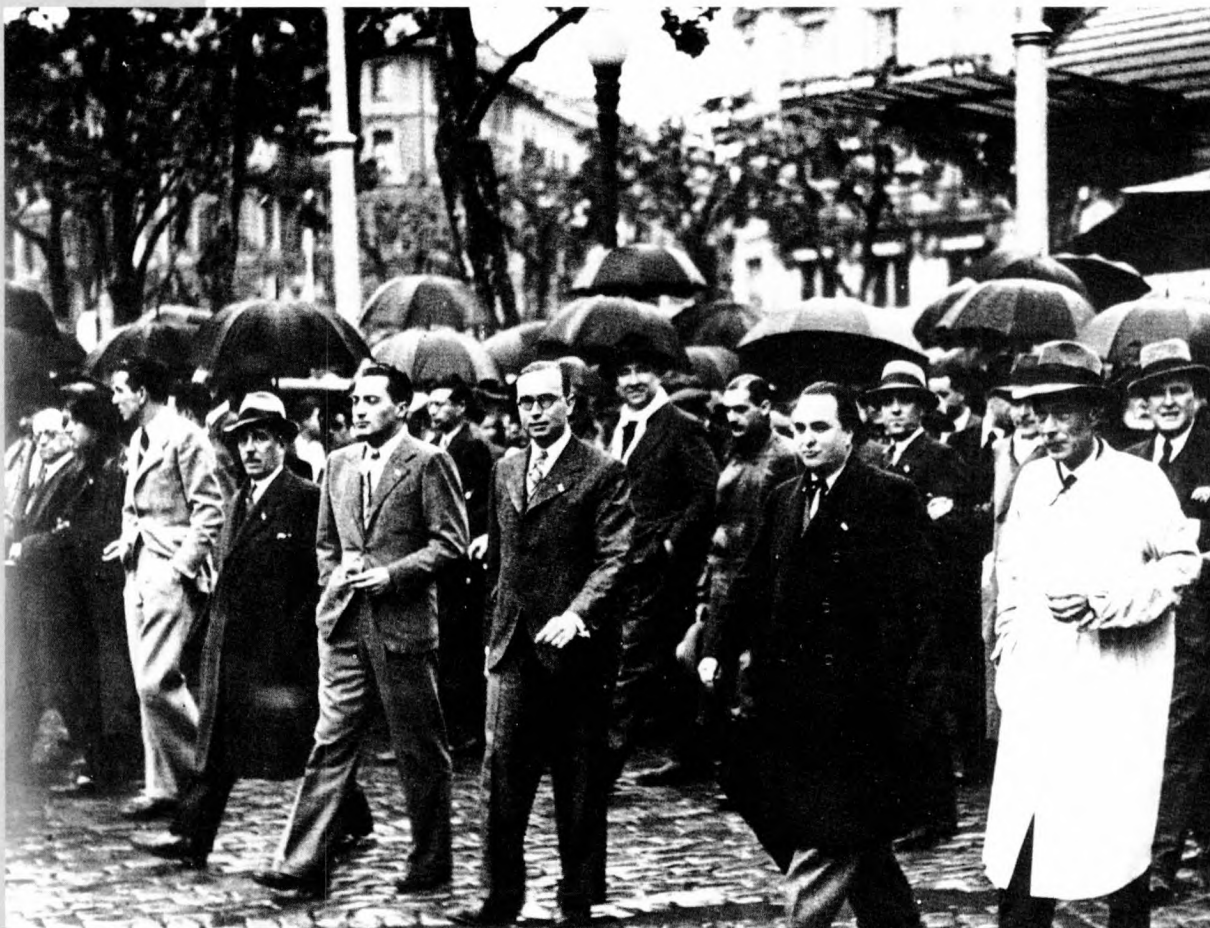
Manifestació antifeixista, abril de 1934.

de tots, el més gran, va ser l'aprovació, el 1932, de l'Estatut d'autonomia de Catalunya, perquè oferia