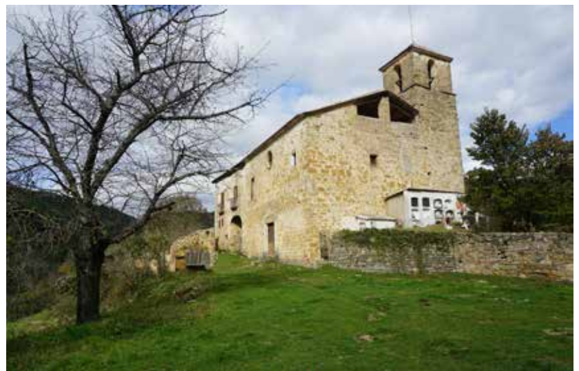
Rectoria de Llinars: on es produí un dels seus famosos robatoris.