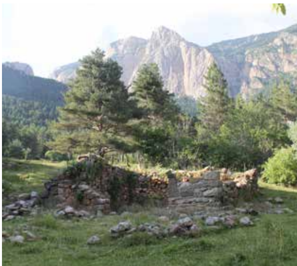
Ruïnes de Cal Guineu al veïnat de la font del Pi.