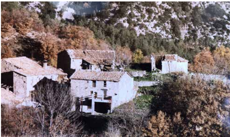
Molers, a la dreta el temple abans de ser restaurat, és on es confessà i passà la seva darrera nit.