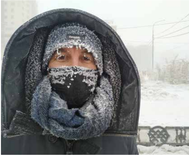
Pelat de fred.

l'amença, perquè quan hi ha aquest clima, l'economia i tot comença a trontollar; però jo crec que ell ho deia sincerament i pensava que els Estats Units estaven exagerant, i que per la situació de por en sortirien perjudicats.