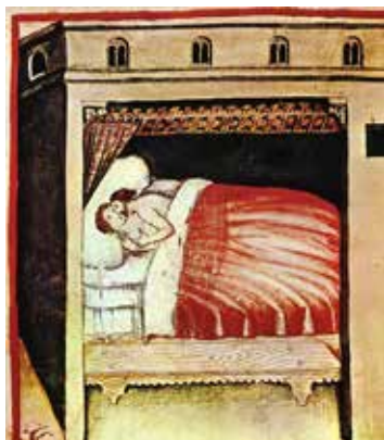
Liber Tacuina sanitatis (XIV century), Ubuchasym Baldach, s. XIV-XV, Bibliotheca Casanatense Roma. Italia.

Analtzem aquest passatge relatat per Comes en la seva declaració. Primer de tot voldríem destacar una expressió emprada pels dos individus “Pel cap de Déu”. Aquesta expressió –que era ben comuna a l’època– era usada per donar fermesa a les afirmacions que es llençaven. L’ús de les paraules i les expressions ens entrega molta informació entorn al marc mental de l’agent que les encunya. En aquest cas concret, podem contemplar una societat profundament imbuïda de la mentalitat cristiana. En la present línia cal ressaltar que fou precisament en aquest període de finals del segle XIV i principis del XV, quan van proliferar al llarg de la geografia catalana diverses ordinacions que prohibien precisament l’ús d’expressions com la referida, un exemple clarivident són les ordinacions sobre pesca i venda de peix del 1401 al 1404 fetes a Palafurgell, estudiades atentament per Pons Guri, on si pot llegir que es prohibeix explícitament jurar pel “cap, cor ne ventre de Déu ne de Madona Sancta Maria i tampoc pel cul ne fetge