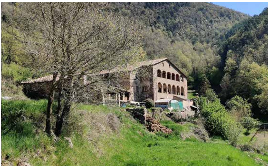
Vista de la masia del Bruc (la Pobla de Lillet, Berguedà).