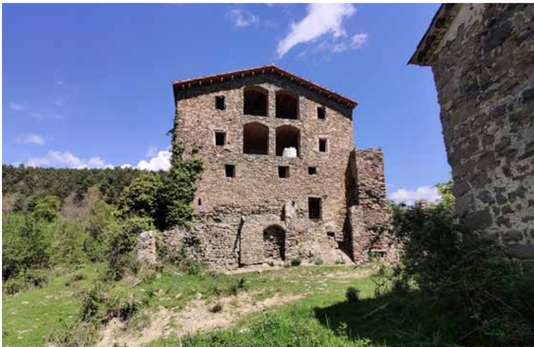
Vista de la casa forta de Solanllong (Gombrèn, Ripollès).