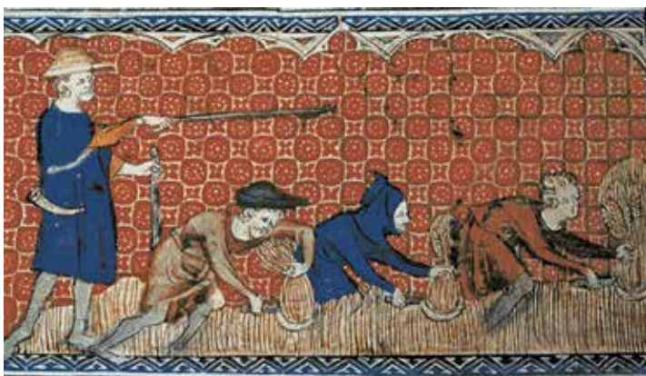
Miniatura del Saltiri de la Reina Maria, s. XIV, British Library, Regne Unit.

caven una millora substancial de la condició pagesa, ans al contrari, la dinàmica d'asserviment que es portava duent a terme des del segle XI estava lluny de veure's aturada. Els pagesos esdevien vassalls i, per tant, serfs a través de l'homenatge servil, pel qual quedaven estretament lligats a la terra que haurien de conrear i treballar, així com respondre d'una sèrie d'obligacions davant del seu senyor, 21 convertint-se d'aquesta manera en homes propis, quitis, naturals i de remença dels seus senyors, perdent d'aquesta manera llibertats tan bàsiques com la mobilitat.