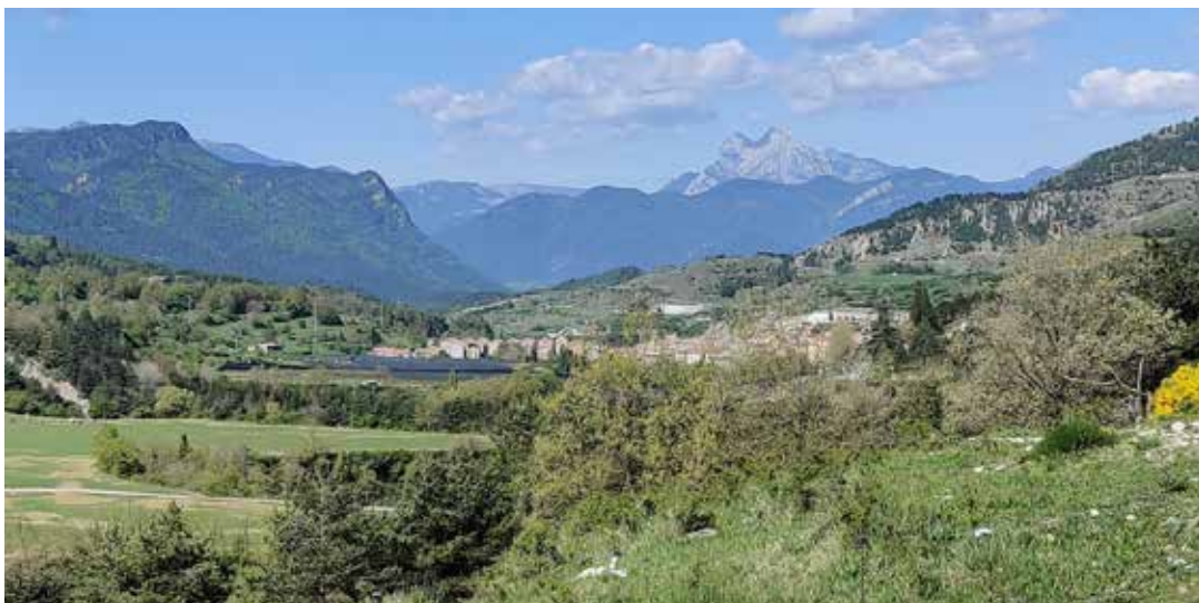
Vista de la vall de Lillet amb el Pedraforca de fons.

Elements tan quotidians com les nostres converses diàries, són –sense que en siguem del tot conscients– grans magatzems d'informació que ens parlen de nosaltres mateixos, de les persones que ens envolten, de la situació econòmic-social del període en què vivim, entre moltes altres informacions que seria tan llarg de relatar que no acabariem pas mai. Les converses privades, doncs, esdevenen un bon vehicle per a tot aquell forà