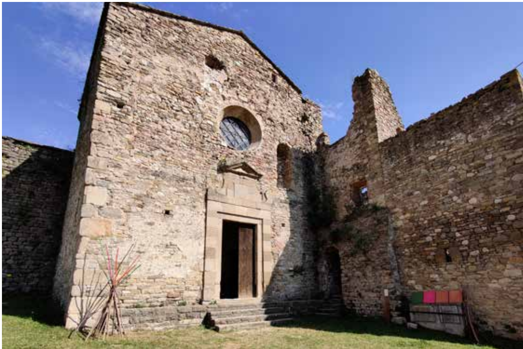
La canònica de Santa Maria de Lillet (la Poble de Lillet, Berguedà).