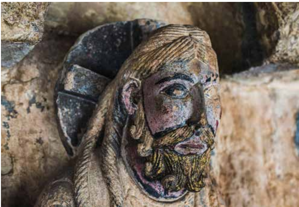
L'espectacular portalada romànica del monestir de Ripoll, presidida pel seu Pantocràtor, es testimoni mut de la història del monestir, de Ripoll i d'una part del país.

En el cas de Ripoll, aquests càrrecs de paborde, de control dels béns monàstics en diferents zones, varen subsistir fins a la fi del monestir (1835).