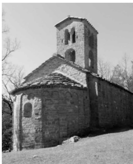
Sant Sadurní de Rotgers.

Com a dada que ajuda a calibrar el valor econòmic del monestir de Ripoll, cal indicar que segons Barraquer, el valor líquid anual de l'abadia de Camprodon l'any 1822 era de 1.360 duros o 2.206 lliures catalanes amb uns ingressos mitjos anuals durant el quinquenni de 1817-1821 de 81.867 reals 16 .