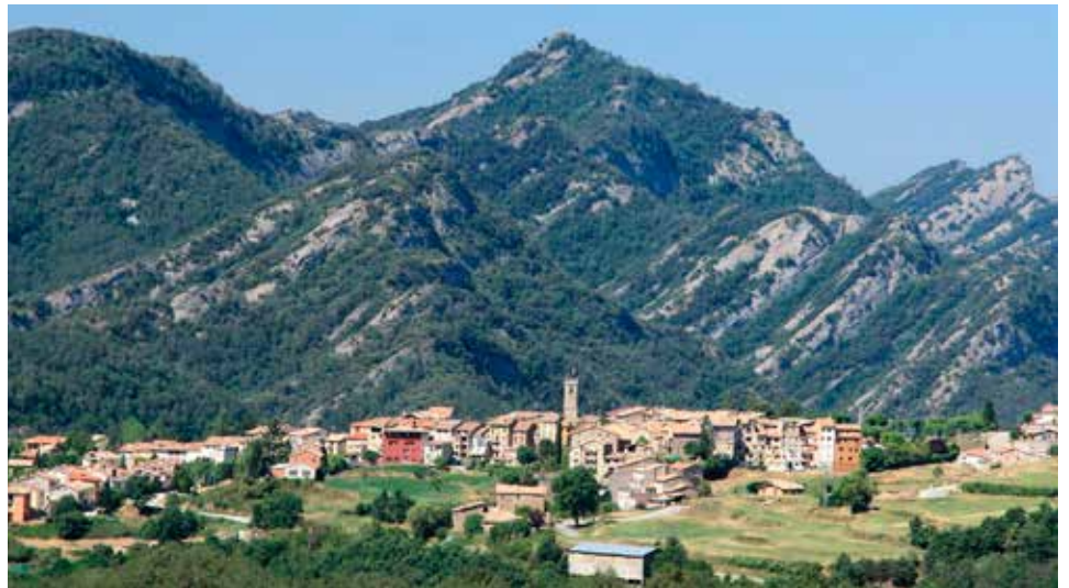
Borredà, un dels principals dominis del monestir de Ripoll al Berguedà

De l'any 1807, Gaietà Barraquer aporta també les dades del llibre del tall de Religió, on s'especifica la renda de cada abadia i prebenda monàstica, per fer la contribució al sosteniment dels gastos dels monestirs, del noviciat situat a Sant Pau del Camp i per la celebració del capítols generals de la Congregació 13 . Segons aquestes dades, l'estat econòmic del monestir de Ripoll era poc abans de la guerra del Francès: