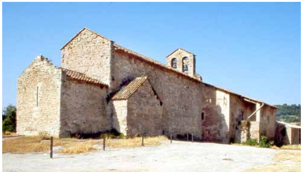
Sant Vicenç d'Obiols, un domini ripollès antic, citada a l'acta de dotació de l'abadia del 888.

«Abadia, renta líquida anual, 1.5000 libras catalanas, equivalentes a 800 duros. Camarería = 477 libras, 10 sueldos = 254 duros, 3 pesetas, 33 céntimos. Limosnería = 458 libras, 10 sueldos = 244 duros, 2 pesetas, 66 céntimos. Sacristanato Mayor = 879 libras, 15 sueldos = 471 duros, 1 peseta. Pabordía de Palau = 152 libras, 2 sueldos = 81 duros, 0 pesetas, 60 céntimos. Pabordía de Berga = 443 libras, 18 sueldos = 236 duros, 3 pesetas, 75 céntimos. Pabordía de Aja = 279 libras = 202 duros, 0 pesetas, 66 céntimos. Enfermería = 300 libras = 160 duros. Dispensa Mayor = 240 libras = 128 duros. Dispensa Menor = 20 libras, 8 sueldos = 10 duros, 4 pesetas, 35 céntimos. Obrería = 11 libras, 18 sueldos = 59 duros, 3 pesetas, 40 céntimos. Capiscollía = 62 libras, 10 sueldos = 33 duros, 1 peseta, 66 céntimos. Refitolería = 18 libras, 10 sueldos = 9 duros, 4 pesetas, 33 céntimos. Sacristía, Olería y Tesorería = 40 libras = 21 duros, 1 peseta, 66 céntimos. Suma total = 5.084 libras, 16 sueldos = 2.711 duros, 4 pesetas, 70 céntimos» 14, 15