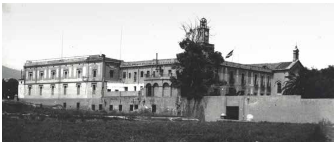
Presó de Dones de les Corts de Barcelona.

El 30 de juliol del 1936 la Junta de defensa nacional de España , que