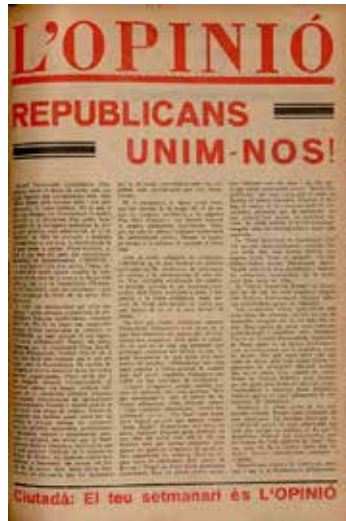
L'Opinió fou un setmanari d'orientació política esquerrana fundat a Barcelona el febrer de 1928.

«Un mes abans dels comicis tenim encara les províncies de Madrid i Osea regides militarment i Espanya entera sense les llibertats mínimes. Afegiu-hi les calamitats enumerades al principi i veurem el magre resultat que cal esperar. Amb vint diputats republicans haurem perdut els catalans, i sense cap, ningú podrà dir que ens hagin derrotat. Portar un diputat d'oposició al Parlament és fer el joc del règim que no pot viure sense ella. Li cal una ombra de minories, una contra miserable que dongui la sensació de que els ciutadans tenim llibertat de pensament i d'actuació. Aquestes i altres raons han estat exposades en la reunió de forces esquerranes celebrada dilluns passat a Barcelona. Encara no hi ha hagut pronunciament o resolució. Esperem-la disposats a seguir-la.