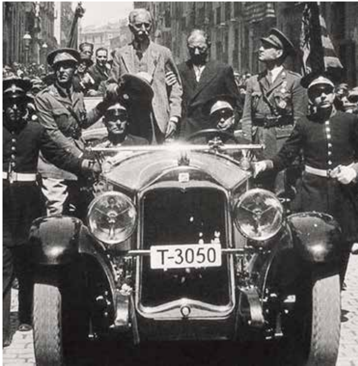
Francesc Macià esdevé el líder indiscutible d'ERC.