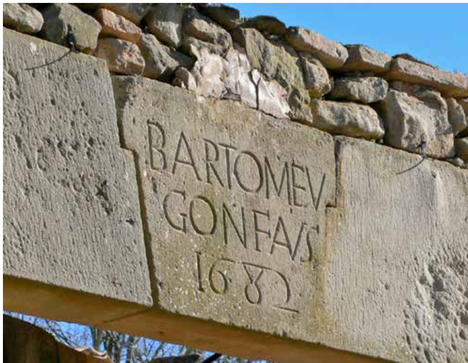
Portal d'entrada al pati de Gonfaus de Sta. Eulàlia Puig-oriol.

un Gonfaus com a cap casa de Sta Eulàlia de Puig-oriol, a la vegueria del Lluçanès/Manresa.