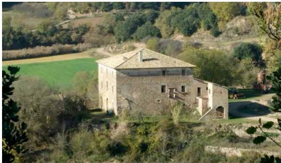
Casa i finca de Gonfaus de Sta. Eulàlia de Puig-oriol.