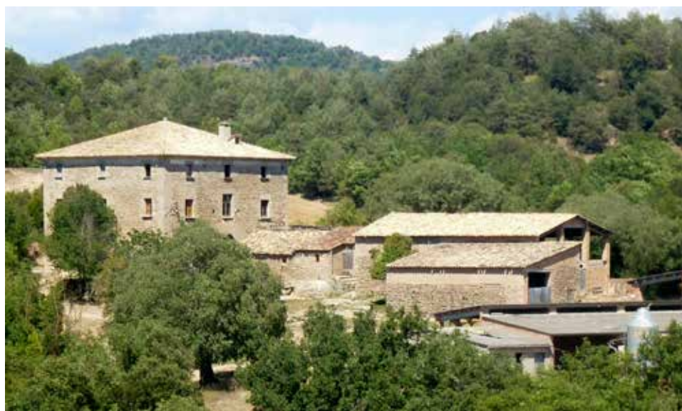
Casa Gonfaus a Santa Eulàlia de Puig-oriol.

La primera menció del mas és de l'any 1325, segons el catàleg de masies de Lluçà. En el document del capbreu 4 del priorat de Lluçà de 1434, s'esmenta la finca de Gonfaus quan es determinen els termes de la batllia de Sta. Eulàlia de Puig-oriol. En els Fogatges 5 de 1497 i 1553 només cita