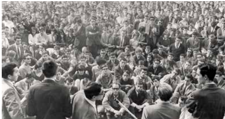
La UB ha posat en marxa una exposició virtual: La lluita antifranquista a la Universitat de Barcelona a l'entorn de 1969