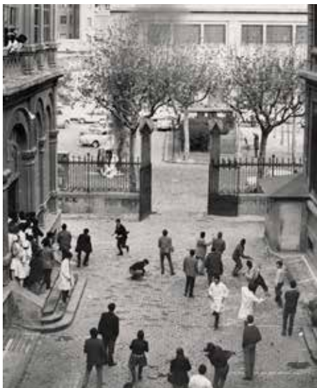
L'acció va provocar molta irritació entre el franquisme