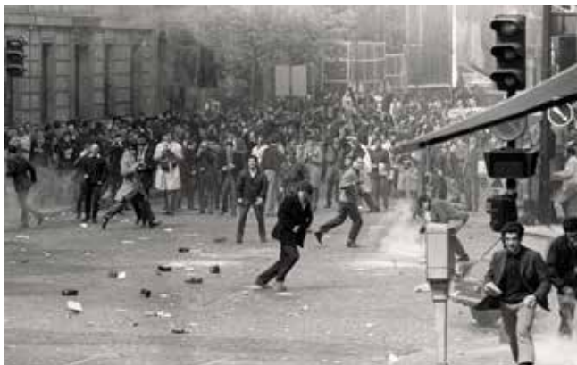
Imatges de l'assalt al rectorat de la Universitat de Barcelona

Els seixanta, a principis encara sonava la música en francès, italià o grec per les ràdios, però de sobte tot va ser en anglès havien arribat els ye yes . La nova cançó, ara en