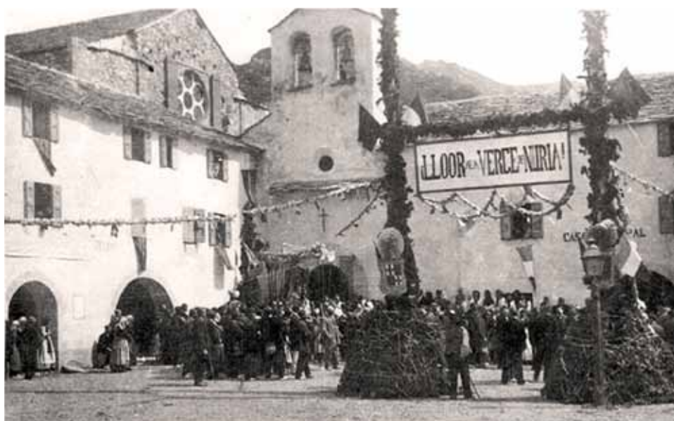
Fig.1 - L'església vella del santuari de la Mare de Déu de Núria en l'aplec de 1918.

Els bons berguedans volien ajudar, però la contribució s'inicià de forma mins i tí-