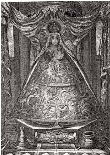
Fig. 2 - La Mare de Déu de Núria en un gravat.

mida a causa de la guerra, el risc de l'empresa i el poc asserenament del moment. Estaven a veure-les venir, afectats pel daltavall provocat per la Revolta Catalana a la comarca, devastada per la pesta.