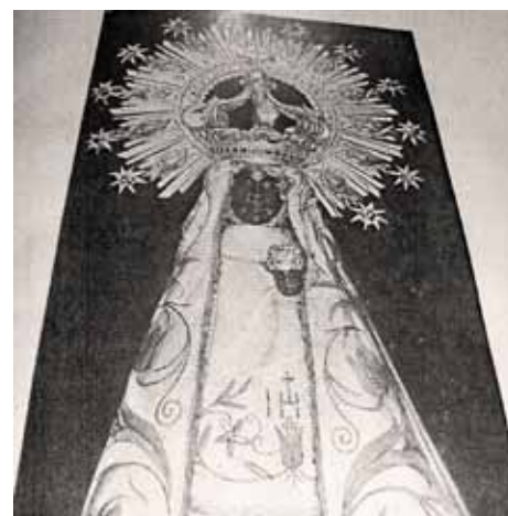
Fig. 4 - La Moreneta de Núria l'any 1935.

Aprofitant un període de relativa calma alguns berguedans desitjosos de contemplar les obres del santuari de Núria s'adheriren a la causa del bon Dídac (fig. 5). Es tractava d'una de les moltes parròquies que peregrinaven al santuari els mesos d'agost i setembre, en companyia d'un cavaller, un doctor en medicina i una dama de Berga. Successivament pujà al santuari un cava-