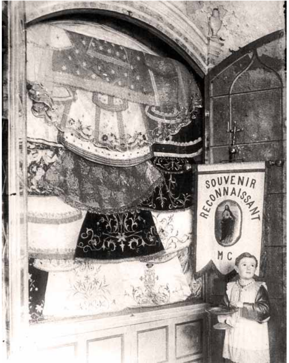
Fig. 8 - «Armari dels mantells de la Mare de Déu de Núria».