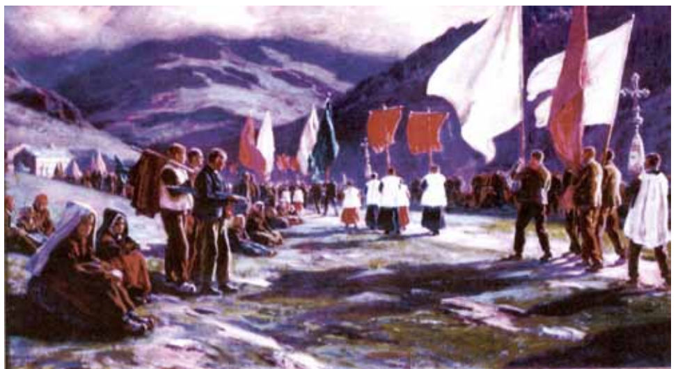
Fig. 9 - Dionís Baixeras, «L'aplec de Núria». Oli sobre tela, 100 x 180. COL·LECCIÓ PARTICULAR.