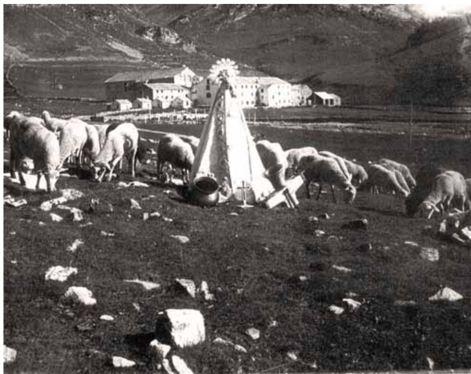
Fig. 7 - «La Mare de Déu de Núria amb l'olla, la campana i la creu».