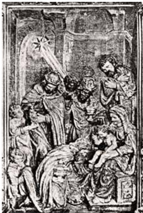
Fig. 5 - Domènec Casamira, «L'adoració dels Reis». Detall del retaule Major de Núria.