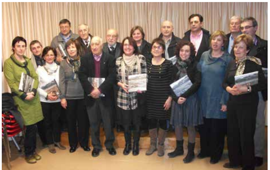
2013. Presentació del llibre de La Vall dan.