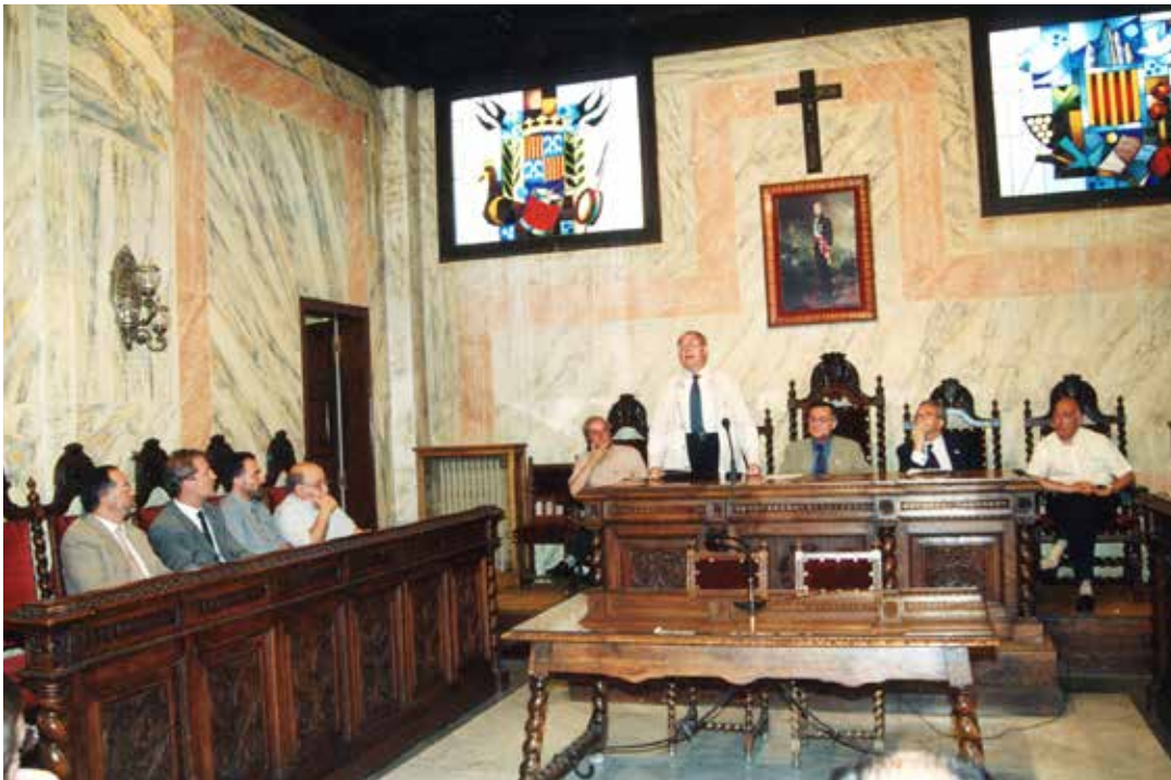
2001. Presentació de l'exposició «El Berguedà al segle XX».