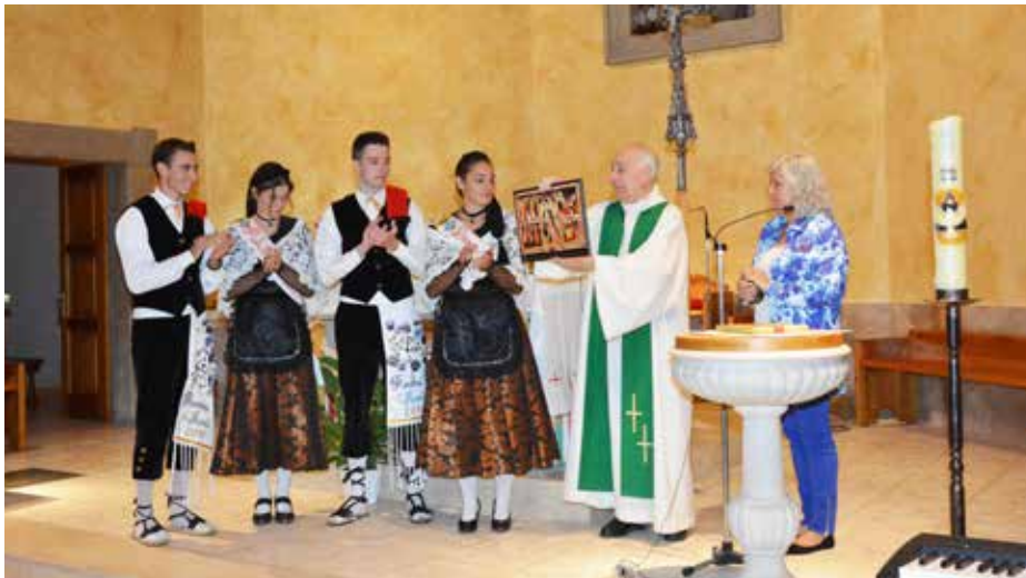
2018. Comiat de la parròquia d'Avià amb motiu del seu retir.