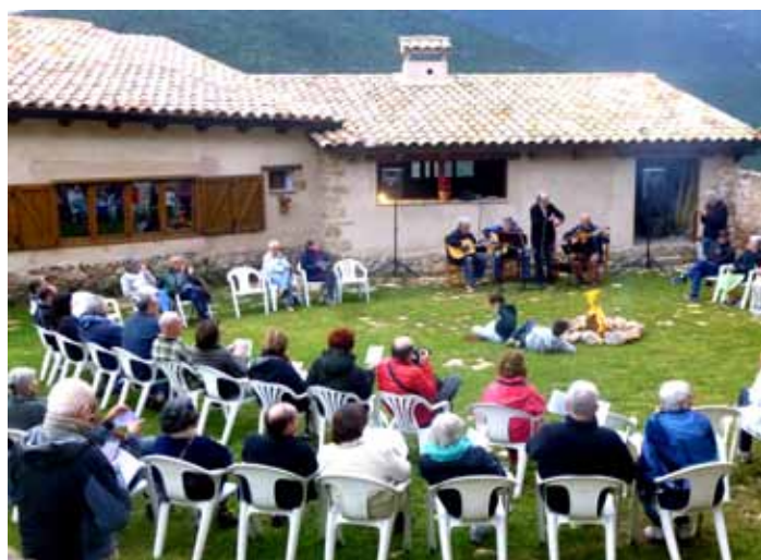
Foc de camp a l'era de cal Capdevila de l'Espà (01.07.2017).