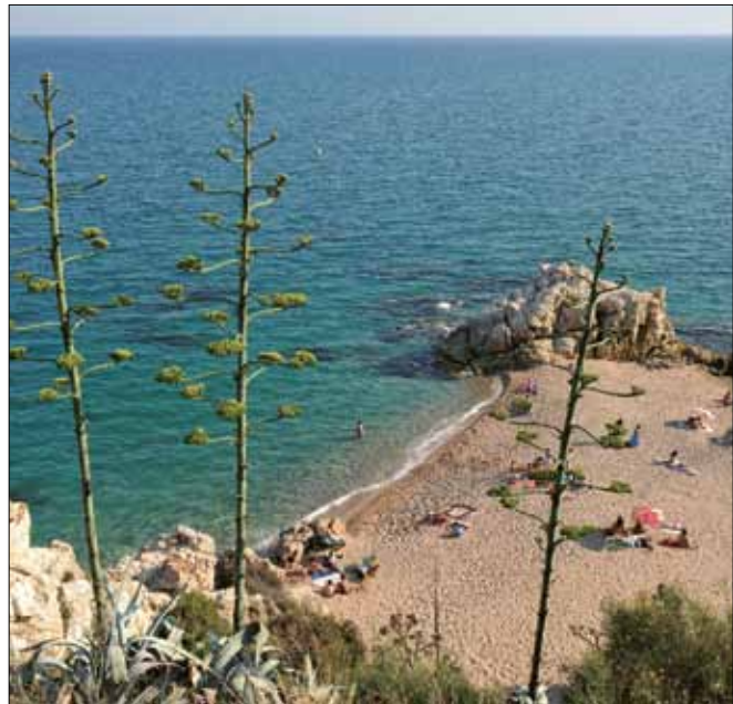
Roca Grossa a Calella (Maresme).