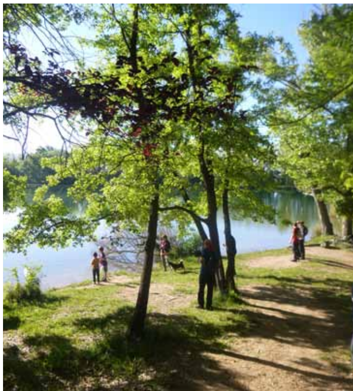
El llac de Graugés. (07.05.2017).