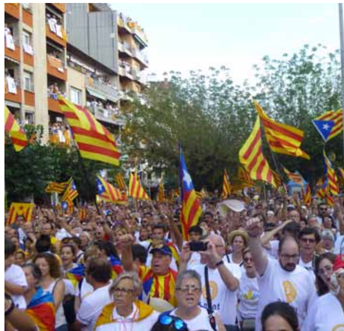
El passeig de la Pau, de Berga, l'11 de Setembre del 2016.

De l'any 2014 en destaca la consulta no vinculant i la «confessió» de Jordi Pujol. El gener, el Parlament va sol·licitar al Congrés de Diputats la delegació a la Generalitat de la competència per celebrar el referèndum, proposta