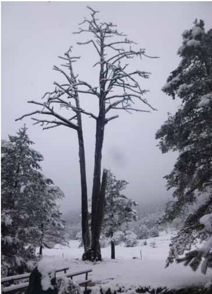
El Pi de les Tres Branques, nevat (24.04.2017).

sentació parlamentària, menys PP i Ciutadans, van congregat 1.000.000 de persones a Barcelona sota el lema «Som una nació. Nosaltres decidim» contra la sentència del TC. El novembre, Artur Mas (CiU) va guanyar les eleccions al Parlament basant la campanya en la demanda d'un pacte fiscal semblat al concert econòmic del País Basc. O sigui que, en aquest moment, tenim, per una banda, un sector ja clarament independentista, OC i el moviment de les consultes, i per l'altra, un de partidari d'esgotar totes les vies, CiU: si no aconseguim el pacte fiscal, llavors serà l'hora d'apostar per la independència.