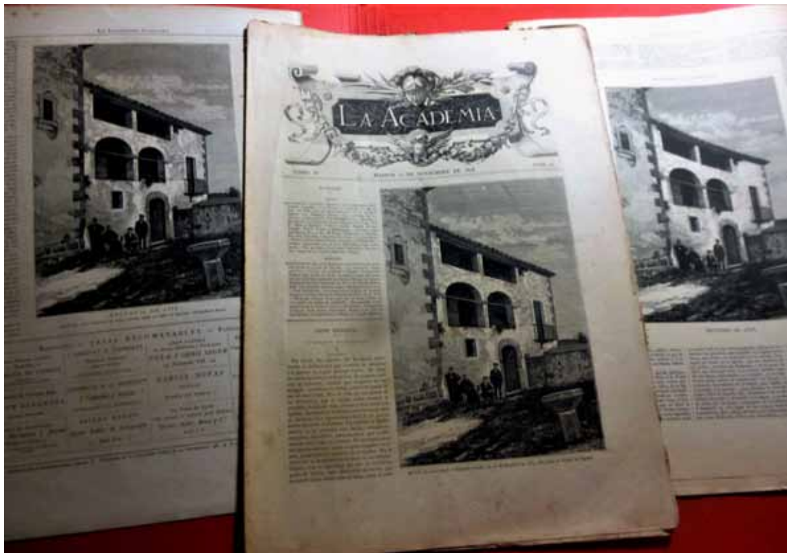
Gravat de la rectoria d'Avià publicat a La Academia (1878), La Ilustración Catalana (1881) i La Ilustración Católica (1884).

d'una unitat carlista; el 1974 va protagonitzar, amb una pastoral que demanava el reconeixement de la identitat cultural i lingüística del poble basc, el més gran enfrontament entre l'Església i el Règim franquista, el "Cas Año-veros".