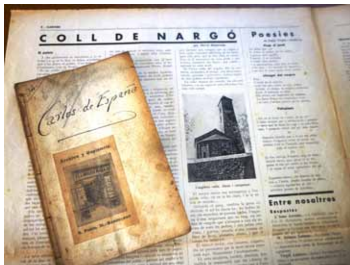
L'article de Mercè Rodoreda sobre Coll de Nargó a Clarisme (1933) i portada de l'obra de teatre Carlos de España (1869).

Sobre el Comte d'Espanya s'ha escrit molt. Mercè Rodoreda, per exemple, va publicar un reportatge sobre Coll de Nargó al número 3 del setmanari Clarisme. Periòdic de Joventut - Art i literatura (1 de novembre de 1933) on hi ha un paràgraf sobre ell: «Entre aquesta població [Coll de Nargó] i Organyà, un camí de carros s'ajunta a la carretera per mitjà d'un pont, famós, anomenat d'Espia o d'Espí, i des del qual, els carlins, després d'assassinar-lo, llençaren el cos del capitost Carles d'Espanya, que, recollit,