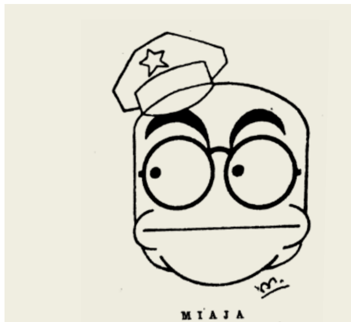
Caricatura del general José Miaja a La voz de España (Any 1939).