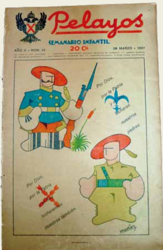
Portada de la revista Pelayos (28.03.1937).