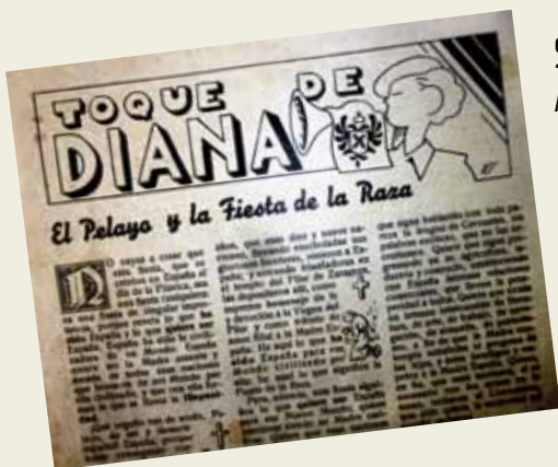
Capçalera de la secció "Toque de diana" a la revista Pelayos .