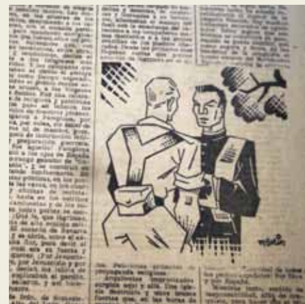
Il·lustració d'un article del futur bisbe de Bibao Antono Añoveros. El pensamiento navarro . (Any 1939).