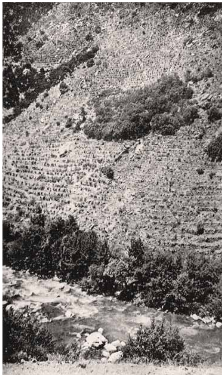
Vinyes al Pont de Bar 1950. (Alt Urgell). LLOBET