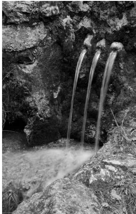
Font de l'Arç.

La Font de l'Arç és una de les més conegudes del poble i el camí que hi arriba no és gens complicat de fer.