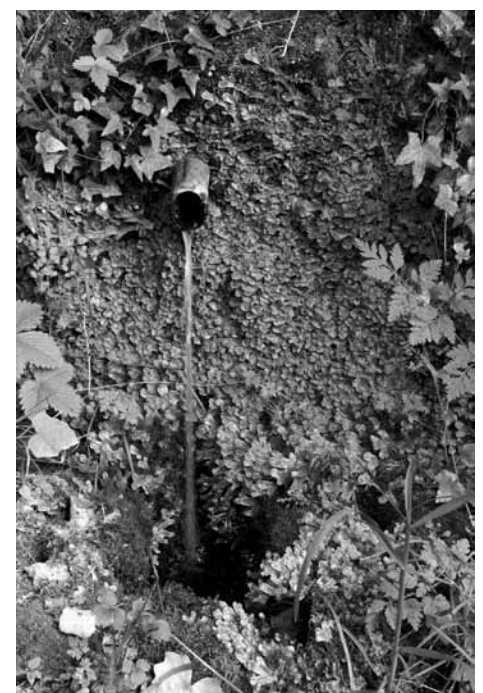
Font de la Pega.

Per anar a la font hem començat des de la Plaça de l'Ajuntament i hem seguit tot el Carrer Castell de Roset fins arribar