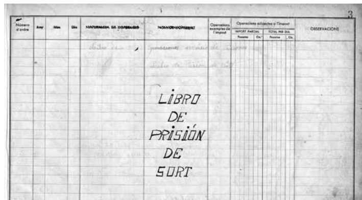
Llibre de la presó de Sort on es van anotar els noms dels refugiats que eren capturats pels camins del Pallars i empresonats en aquella petita presó, avui convertida en museu.

Un dels personatges clau en l'organització d'aquestes fileres a Andorra fou Francesc Viadiu Vendrell (Solsona, 1900 - Sant Llorenç de Morunys, 1992). Antic alcalde de Solsona i Diputat al Parlament de Catalunya durant la Segona República s'havia exiliat a Andorra on col·laborava amb