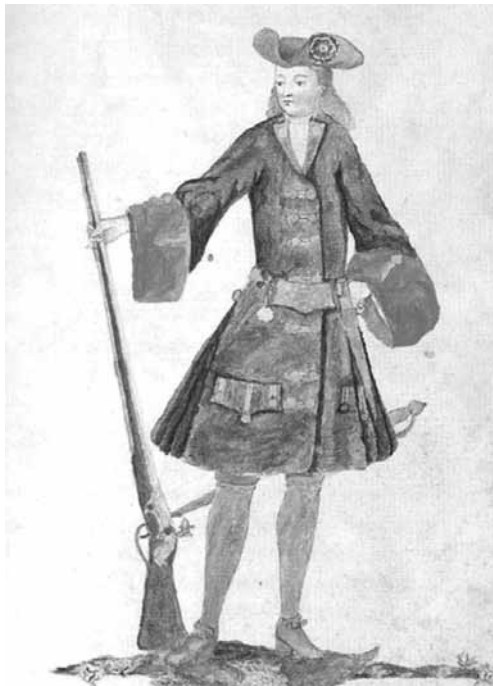
Il·lustració del llibre de passanties del Gremi d'Argenters de Barcelona que mostra un milicià de la Coronela de Barcelona. Dibuix de Gaspar Ferran, 1707. AHCB