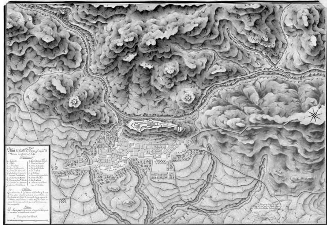
Centro Geográfico del Ejército, SG, Ar. F-T./-C.2-197 (1). Plano del Castillo de Berga, y Croquis del terreno inmediato a él (1811).

Amb la revolta antifiscal esdevinguda a bona part de la Catalunya central a mitjan gener del 1714, nombroses poblacions s'amotinaren contra les guarni-