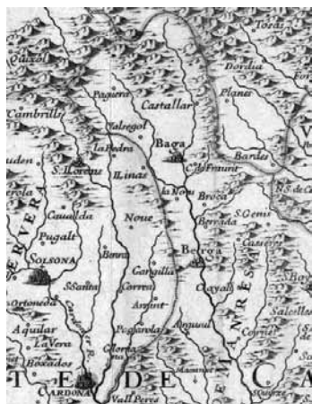
Representació del Berguedà en un plànol cartogràfic de Catalunya de finals del segle XVII (ICC)

El dia 6 de març del 1714 el marquès del Poal va atacar amb les seves tropes el marquès de Thouy, que es trobava amb el seu destacament borbònic als passos de Borredà i del Pont de Miralles, i es dirigia a Berga per socórrer la seva guarnició. En l'emboscada, els borbònics perderen uns 200 soldats, dels 3.000 que forma-