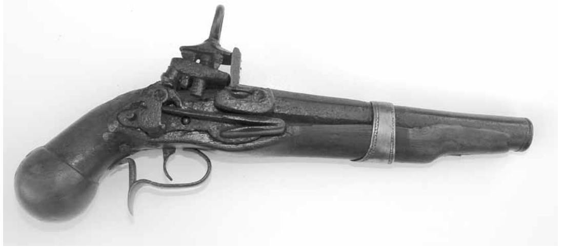
Les armes fabricades a Ripoll es van escampar per tot el país (ARXIU ARB)

A començament de juny de 1695 el clavari, per ordre del Consell, havia gastat 15 lliures “per un refresh se ha donat al tercio dels napolitans per no allotjar-lo” . Però el primer dia d’agost de 1695 els alts funcionaris de la monarquia