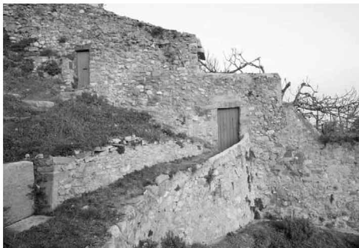
Els horts urbans formaven part de l'avitallament de la tropa (ARXIU ARB)

també estigué al punt de mira d’aquest grup de consellers. El seu cas el tenim molt més documentat que no pas el del conseller Claris, però no per això deixa de ser menys sospitós. A començaments de l’any 1700 fou desinsaculat, al·legant que mentre va estar nomenat dins de la bossa de conseller quart va rebre l’arrendament de l’hostal de la vila. Pocs dies després, el mateix Viladomat iniciava un litigi amb els consellers en actiu, fins que, el 27 d’abril del mateix any, una resolució de l’Audiència obligava les autoritats municipals a tornar-lo a insacular. El més curiós és que ni ell ni cap membre de la seva família havia tingut l’hostal de la vila arrendat.