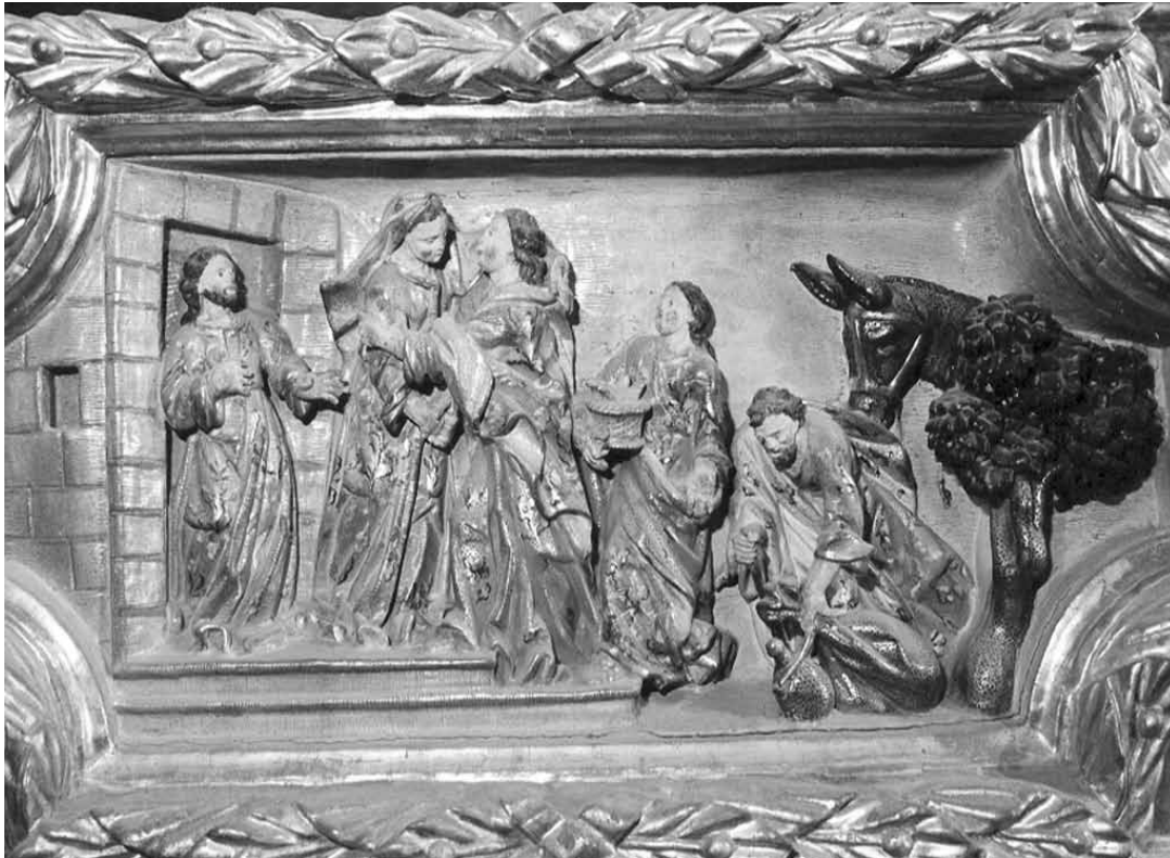
Detall del retaule barroc de l'església de Casserres

Davant d'això, l'austriacista Joan Miquel cominà dues vegades més la població per posar-la al servei de l'Arxiduc, però a Berga "se apresuraban a armarse y organizarse por compañías, reparaban las murallas y abastecían el castillo con toda clase de víveres". Fins i tot es compraren 3 robes de pólvora "per tenir a la casa de la vila", però els missatgers que arribaven a la vila posaven de manifest l'imparable avanç territorial dels partidaris de l'Arxiduc. Malgrat tot, les possibilitats de posar-se en contacte i ser ajudats per l'exercit filipista eren quasi nul·les i Portus, el governador francès de Montlluís, no els va poder facilitar els efectius humans que els consellers li havien demanat, tan solament dues càrregues de municions. Esdevenia, per això, un panorama cada vegada més pessimista de poder escapar amb èxit d'un setge imminent. El Consell i els braços es reuniren novament i van optar per rendir-se a favor de l'Arxiduc, considerant una temeritat defensar la plaça, i tement "que tanto país alistado descargara contra ellos su furor" (18).