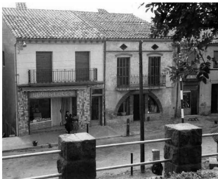
Cal Peu Pla.

La formació d'ERC guanyà les eleccions al poble de Puig-reig i es va formar una Junta Provisional