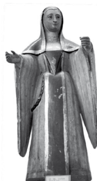
Monja beneta, una peça gòtica donada per la família Felipó al Museu Comarcal de Berga.