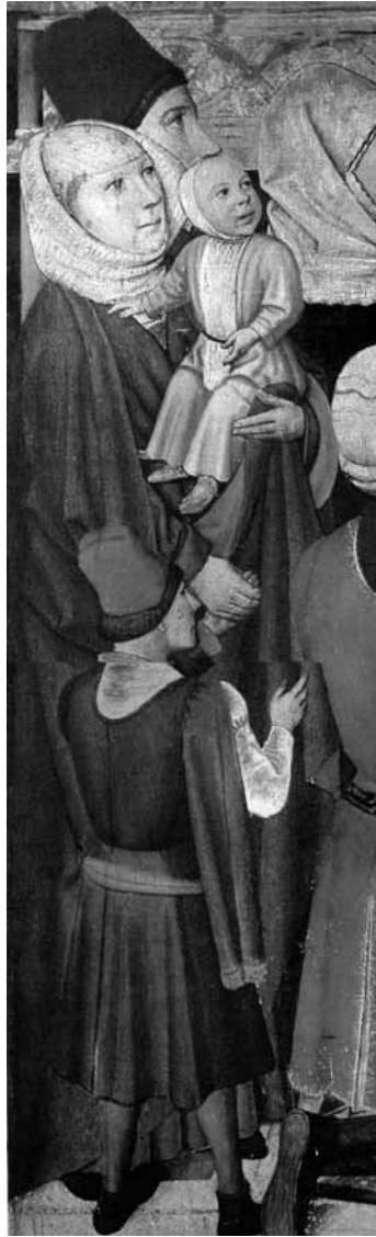
Reproducció d'un fragment de retaule gòtic.