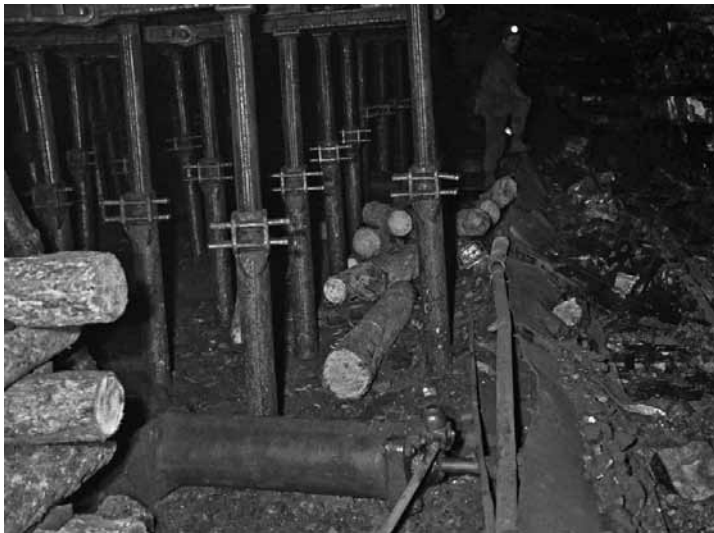
La fotografia mostra el sistema de apuntalament del sostre de l'exploració mitjançant els puntals o "estemples" metàl·lics de fricció i les gàbies de fusta. S'aprecia amb tota claredat el panzer o transportador blindat, i el cilindre pneumàtic, anomenat "porc" segons l'argot de la mina, que empenyia el panzer cap al front d'exploració.