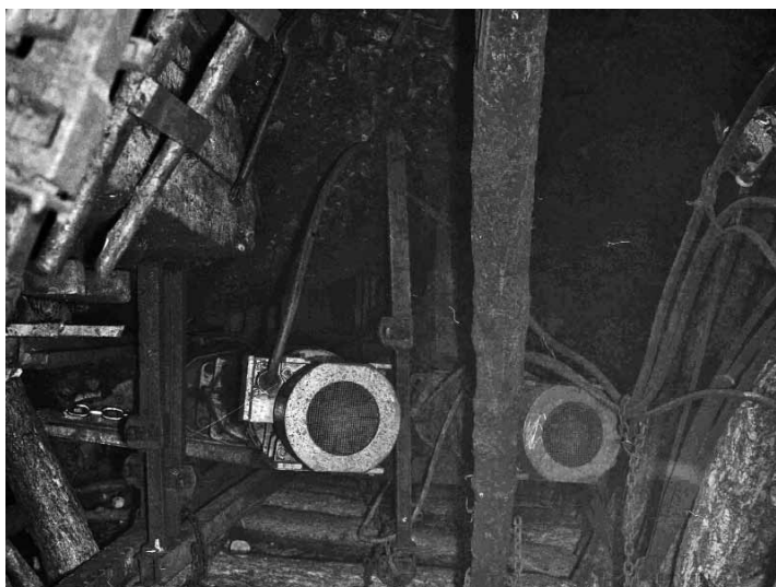
Detall del "Luneto", l'espai destinat a encabir-hi els motors i reductors del raspall i del panzer en el front de l'exploració.

Fins ara hem vist imatges de l'arrencada del carbó; les imatges següents corresponen als sistemes de transport fins al dipòsit de Sta. Isabel, mitjançant les cintes transportadores.