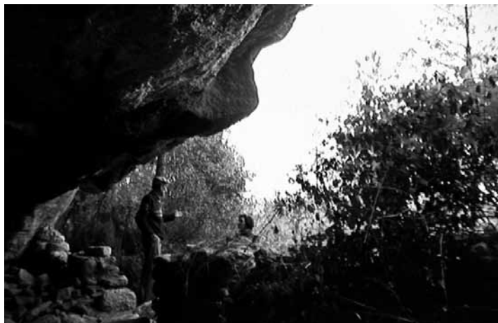
Una de les imatges rodades pel documental en una bauma.

En aquest sentit, l'historiador Ricard Vinyes –un dels grans especialistes del període–, destaca que “perquè l'estat no es volia enemistar i volia fer els reclutaments en el marc constitucional”, les autoritats de la República van concedir una sèrie d'indults a aquells emboscats que es presentessin a files en un període de temps determinat. Ho comprovem en un anunci a La Vanguardia (també del 12 d'abril del 38) on s'indica que “Se concede un plazo de setenta y dos horas, a partir del próximo día 10, para que los individuos que pertenezcan a los