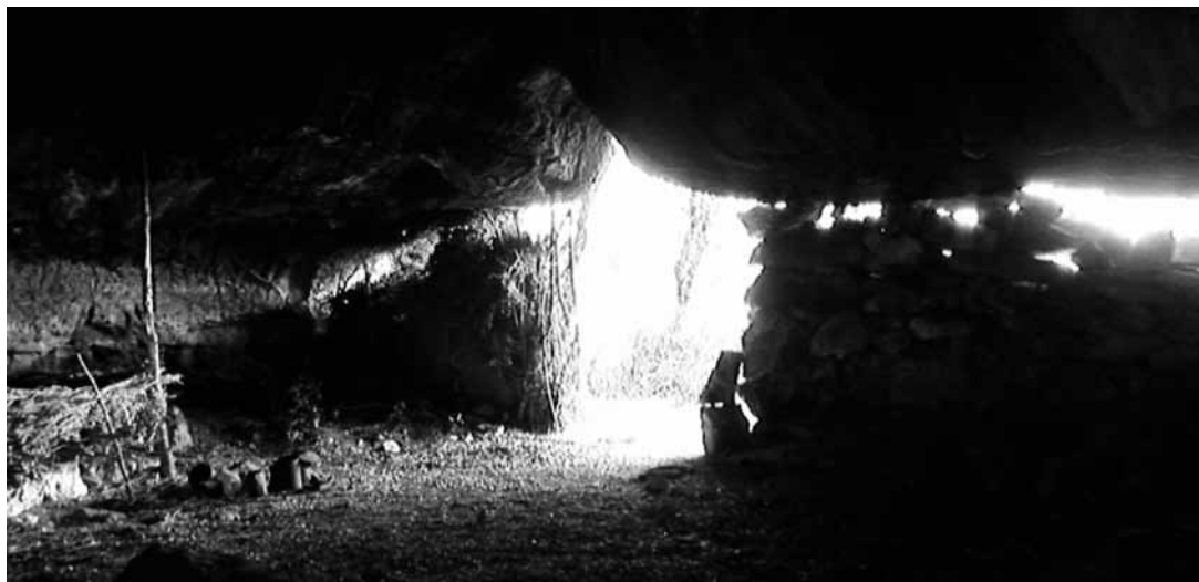
Cova del bosc de Porredon. (Lladurs, Solsonès)

“Els trets no em feien cap gràcia, més aviat em feien por”, assegura