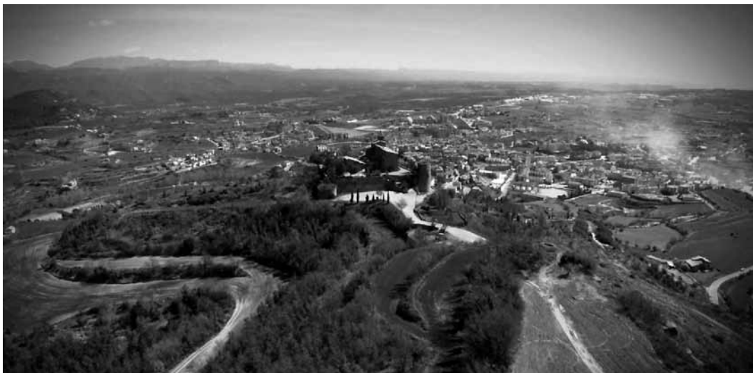
Solsona