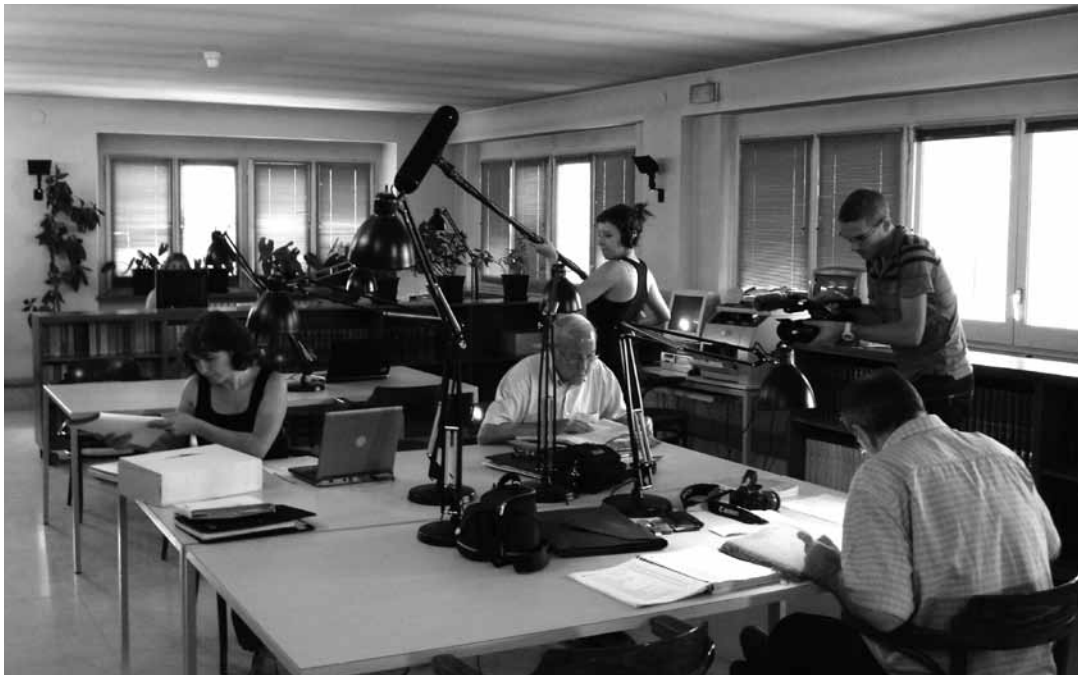
El documental va sorgir arran d'un ampli projecte de recerca sobre la rereguarda i la Guerra Civil a les comarques prepirinenques, recolzat pel Memorial Democràtic i dirigit pel Centre d'Estudis Lacetans.

democrat perquè havia estat menjat pels gossos”.